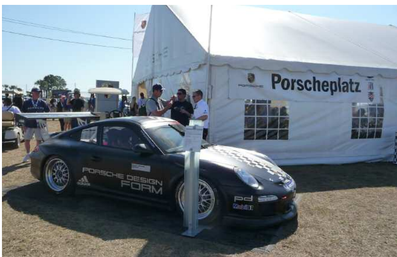
Effet spectaculaire garanti : une nouvelle GT3 Cup de la Porsche Sport Driving School

Si vous n'avez encore jamais visité une manifestation Porscheplatz, venez découvrir en direct des nouveautés et des manifestations passionnantes et vivre l'hospitalité des passionnés de Porsche.