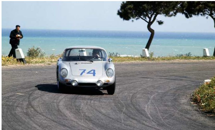
Au départ du rallye alpin : la Porsche 356 B 2000 GS Carrera GT, surnommée « Dreikantschaber », lors du Targa Florio 1964

Vous trouverez plus de détails sur le « musée roulant » à l'adresse www.porsche.com/germany/about-porsche/porschemuseum/rollingmuseum