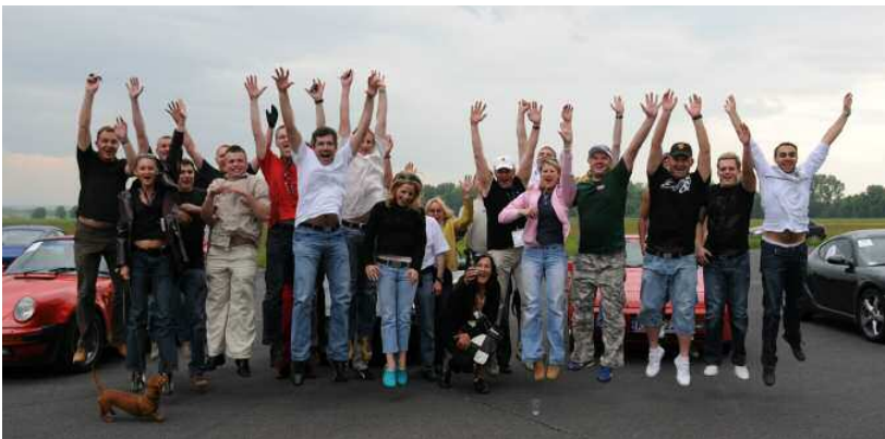
Porsche Club Poland : la passion Porsche à l'état pur

Jarek Guldynowicz Porsche Club Poland www.porscheclub.pl