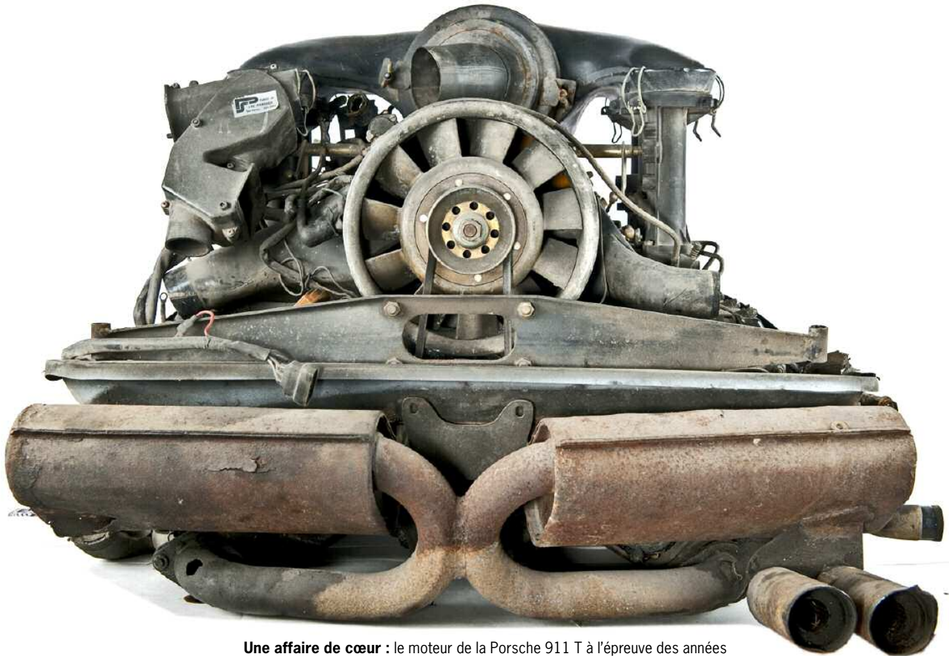
Une affaire de cœur : le moteur de la Porsche 911 T à l'épreuve des années