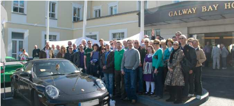
Porsche Pit Stop : le point de départ de l'excursion était le Galway Bay Hotel