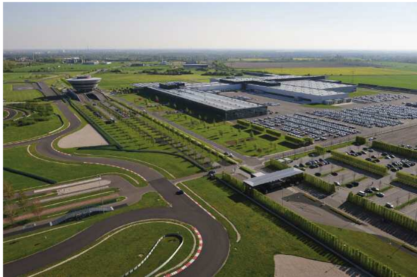
Démarrage à Leipzig : l'usine sera aménagée pour devenir un site de production à part entière du Porsche › Cajun ‹, carrosserie et peinture incluses