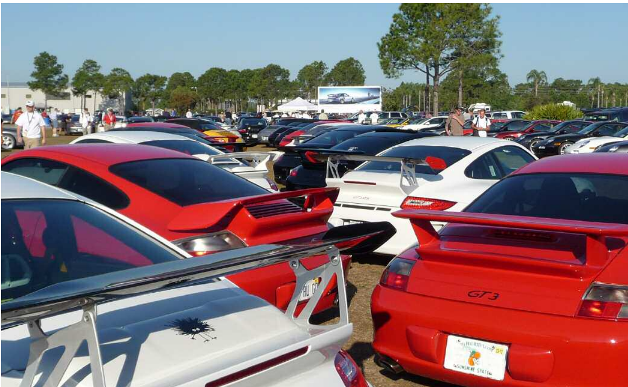
La Porscheplatz a affiché complet et dépassé toutes les attentes

L'expérience Porscheplatz dure deux jours. Le vendredi, 70 véhicules effectuent quelques tours de parade pour tester le revêtement éprouvé du circuit de 3,7 miles. Après la partie sur chaussée, Keven Buckler de TRG et son équipe ont convié les participants à la Porscheplatz à une visite en règle du paddock. TRG soutient le PCA Club Racing depuis de nombreuses années. Il participe aux différentes manifestations à l'affût de talents pour leur proposer des tours d'essai et des possibilités de formation. De nom-