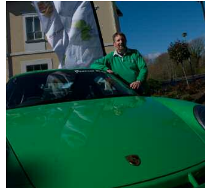
La couleur nationale : la passion Porsche tout en vert