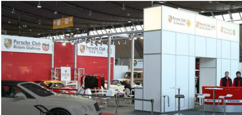
Accrocheur : le Porsche Club Deutschland a sorti les arches

Pour sa première participation au salon Retro Classics de Stuttgart, le Porsche Club Deutschland (PCD) s'est présenté dans les règles de l'art. De même que les Porsche Classic Clubs, la présentation du PCD a été récompensée par le prix du « Meilleur stand de club ».