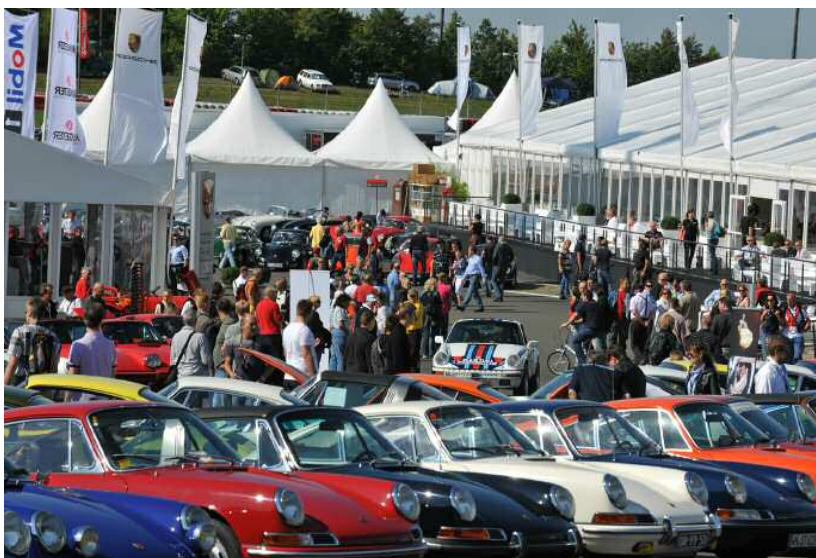
Une foule multicolore : plus de 700 invités au volant de quelque 400 Porsche sont attendus pour la manifestation traditionnelle du circuit du Grand-Prix de l'Eifel