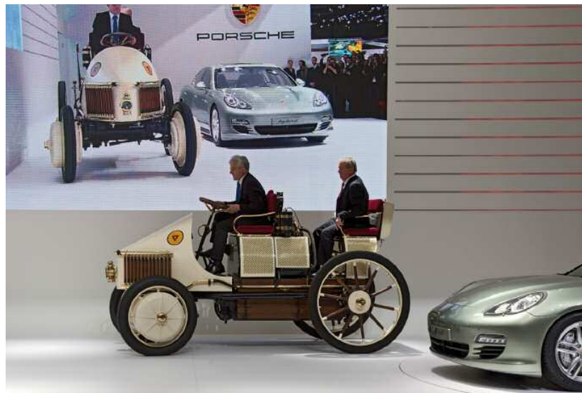
Semper Vivus – Toujours vivant : la Panamera S Hybrid était accompagnée de son ancêtre à Genève

Dans le cadre de sa nouvelle exposition spéciale « Ferdinand Porsche – Pionnier de la motorisation hybride », le Musée Porsche présente la reproduction de la première automobile hybride en état de marche du monde. L'exposition spéciale, inaugurée le 10 mai, plonge le visiteur dans les débuts d'ingénieur du jeune Ferdinand Porsche et explique la technique de la première voiture hybride en série. D'autres pièces d'exception, comme la chaîne cinématique du tout-terrain Cayenne ou la Porsche Hybrid Bike, seront