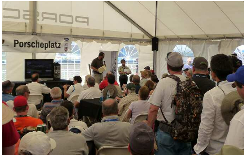
Moment d'attention et de tension : de passionnantes manifestations sont venues parfaire la Porscheplatz