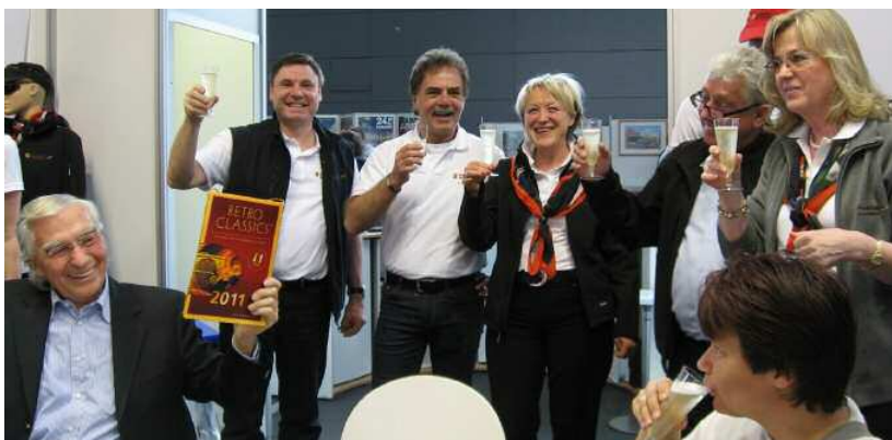
Les vainqueurs des prix de l'équipe du salon trinquent à leur récompense

Tous ces efforts ont été récompensés : le stand a reçu un prix du salon de Stuttgart pour sa présentation exemplaire. Il a été nommé « Meilleur stand de club » conjointement au stand des Porsche Classic Clubs. Double succès à Stuttgart !