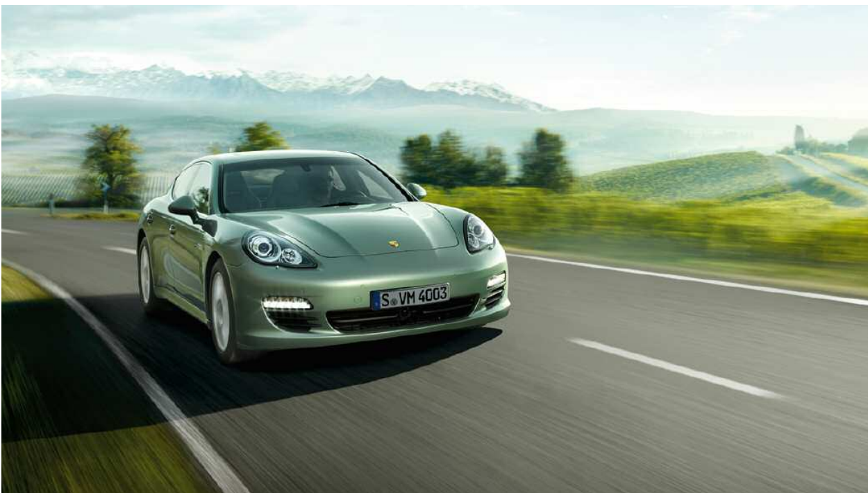
La Panamera S Hybrid : le mode « croisière » sur les autoroutes et les routes de campagne

La Panamera S Hybrid est entraînée par un système qui a déjà fait ses preuves sur le Cayenne S Hybrid : le moteur principal est un V6 suralimenté de 3 litres développant 333 ch (245 kW), associé à un moteur électrique de 47 ch (34 kW). Les deux