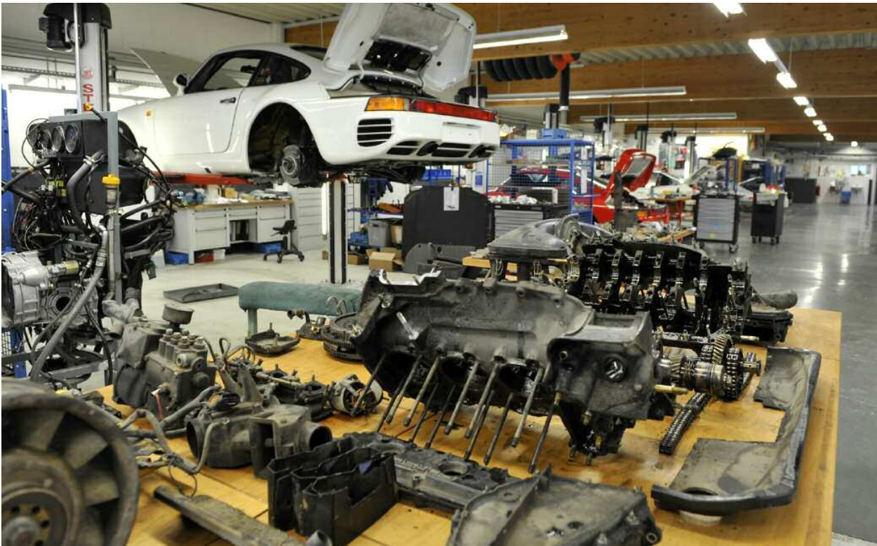
Opération à cœur ouvert : les pièces de l'agrégat 911 T sont prêtes à être traitées dans l'atelier Classic

Ces travaux préalables nécessaires à la reconstruction réussie du moteur ont nécessité le recours à des experts aguerris et ont également engendré des dépenses certes importantes mais indispensables à la restauration complète du véhicule. Il n'existe tout simplement plus de nouveaux moteurs complets de l'année 1973. Une grande partie des pièces d'origine est en revanche disponible. Les spécialistes ont eu recours à d'anciens outils et procédés d'origine pour procéder à l'assemblage et au montage.