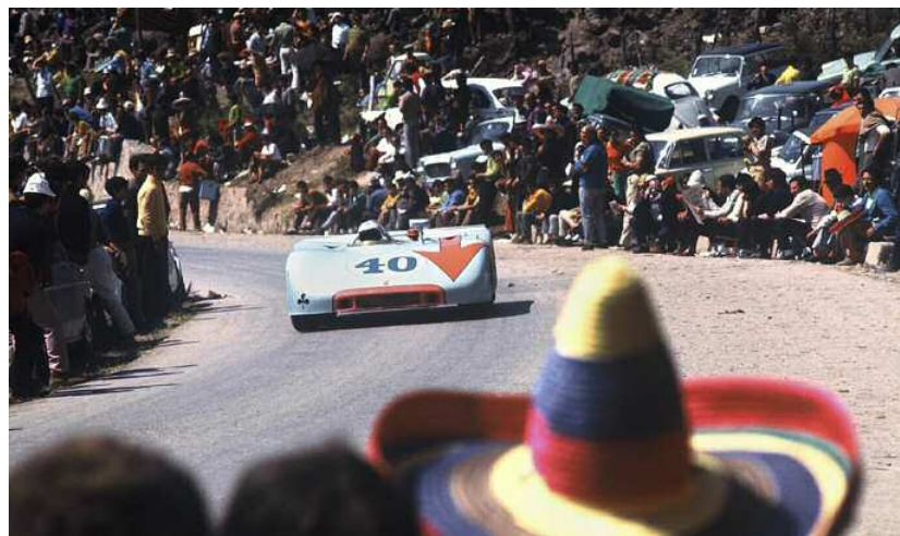
Une invitée de Goodwood : la Porsche 908/03 en piste lors du Targa Florio 1970