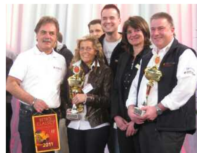
Travail d'équipe : les organisateurs des stands Porsche sur le salon Retro Classic, récompensés pour leurs efforts

Tout au long de la manifestation, les visiteurs se sont pressés autour de la grande table ronde qui servait de point de communication. C'est là qu'ont eu lieu les échanges décontractés avec les sponsors, les Présidents et les directeurs sportifs des Porsche Clubs allemands, mais aussi avec les invités de Porsche, l'Automobile club allemand et d'autres partenaires.