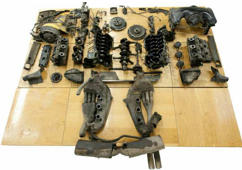
Etat des lieux : le moteur de la Porsche 911 T est tout d'abord complètement démonté, puis la restauration peut commencer