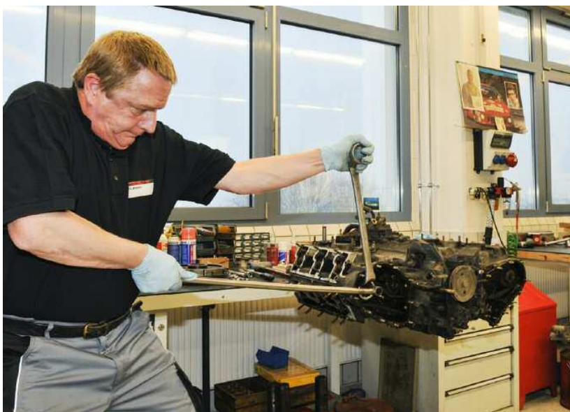
Les sévices du temps : les outils d'origine spéciaux permettent de pénétrer au cœur du moteur

Dans le cadre de la restauration complète d'un moteur d'une Porsche Classic, tous les paliers, joints et sangles sont remplacés par de nouvelles pièces d'origine Porsche, et il en va de même des chaînes de distribution. Ce ne sont pas des investissements très lourds, mais ce sont des pièces que l'on ne découvre qu'une fois le moteur entièrement ouvert. Si l'occasion de les changer se présente, il faut donc en profiter.