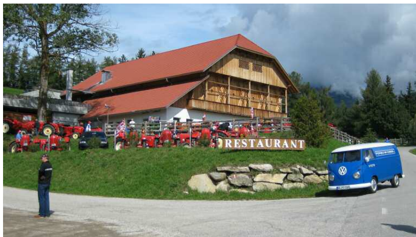
Destination idyllique pour l'homme et la machine