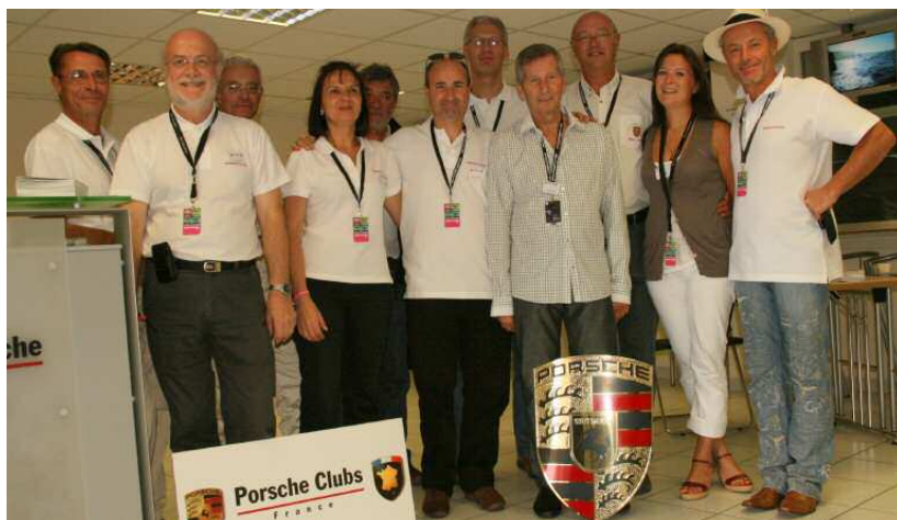
Les organisateurs affichent un visage satisfait

La Fédération des Clubs Porsche de France attend déjà avec impatience la prochaine édition du Festival Porsche, en 2011.