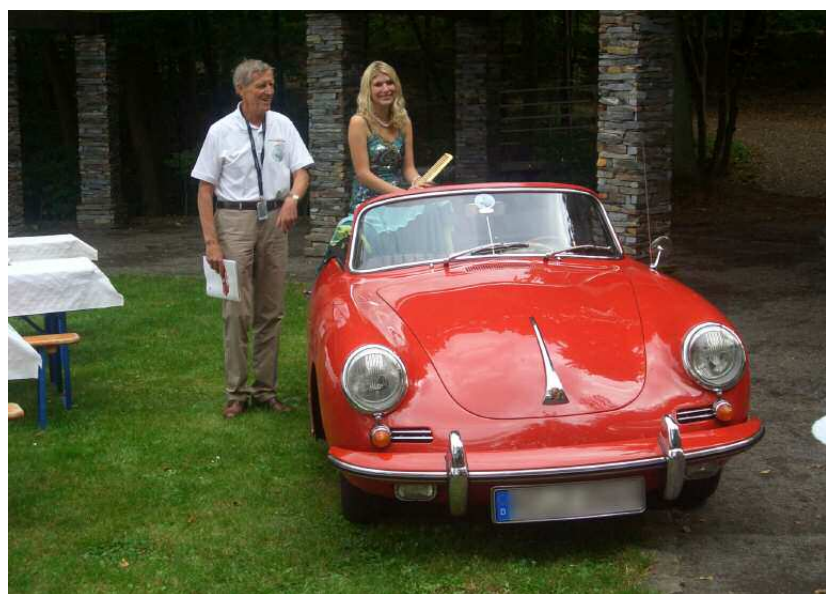
Le mythe Porsche fascine aussi les personnages de légende comme la Loreley

Porsche AG Alexander E. Klein Porsche Club Coordination