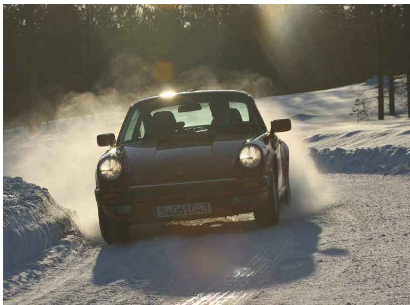
Une 911 classique sur le terrain d'essai de Rovaniemi

L'objectif étant que les conducteurs de Porsche classiques puissent aussi exploiter au mieux les performances de leur véhicule dans toutes les conditions météorologiques et qu'ils ne « restent