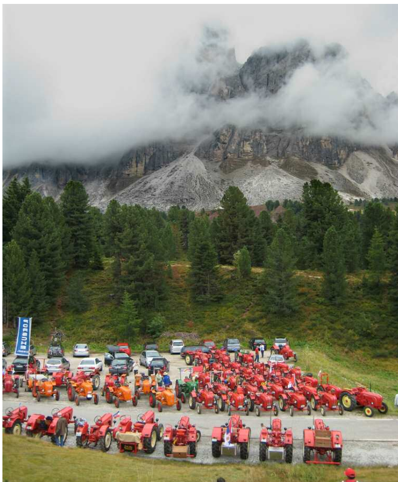
Voyager loin avec un tracteur – aucun problème pour le Porsche Diesel Club Europa

Le tracé s'élevait souvent à 1500 m, voire 2100 m d'altitude, ce qui nous faisait littéralement toucher les cieux. Le soir de cette première sortie, la manifestation s'est poursuivie à l'hôtel « Jochele », où des spécialités savoureuses ont été servies dans une atmosphère détendue, idéale pour des conversations de spécialistes. Les heures sont passées telle-