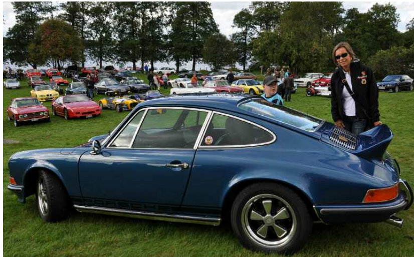
Le Club Porsche de Suède se démarque avec éclat

L'académie suédoise des voitures de sport a été fondée il y a quelques années dans le but de promouvoir et d'honorer l'engagement des bénévoles dans les Automobile Clubs suédois. Pour justifier son choix, l'académie a avancé que le Club Porsche de Suède – l'un des clubs de marque les plus grands et les plus renommés du pays – accorde beaucoup d'importance à la satisfaction de ses membres et à l'engagement du Club. Peu de clubs organisent autant de manifestations pour leurs membres que le Club Porsche de Suède. Le programme comprend même des voya-