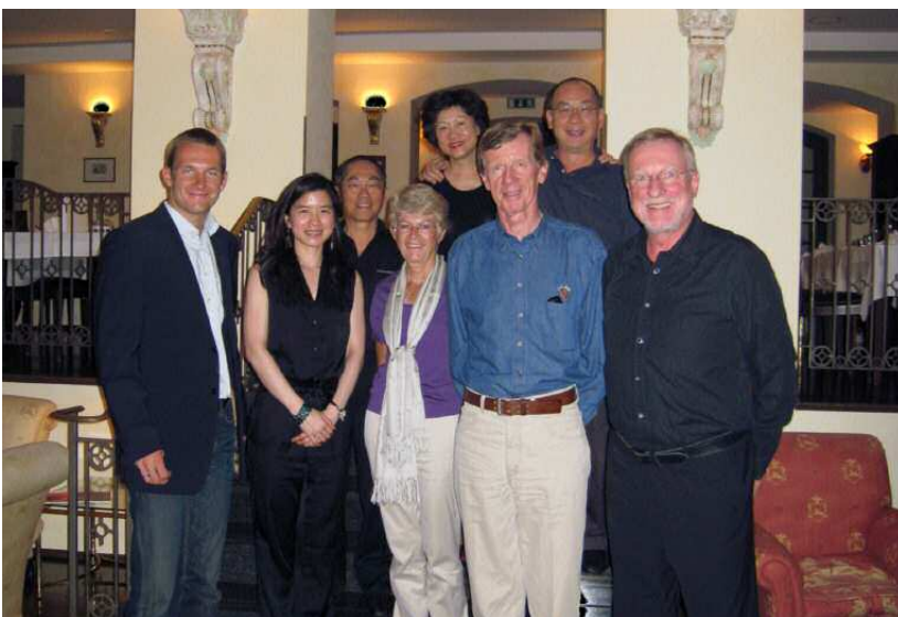
Une rencontre inoubliable : la Porsche Sport Driving School avec Walter Röhrl

Howard Delaney Porsche Club Singapore www.porscheclubs.org.sg