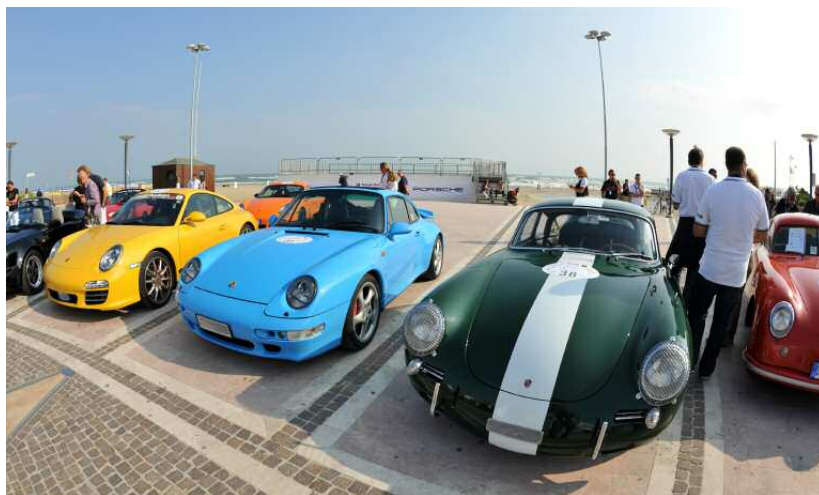
Une vision éblouissante : les Porsche et la mer brillent de mille feux

Porsche Italia Enza Scarafia Porsche Club Coordination