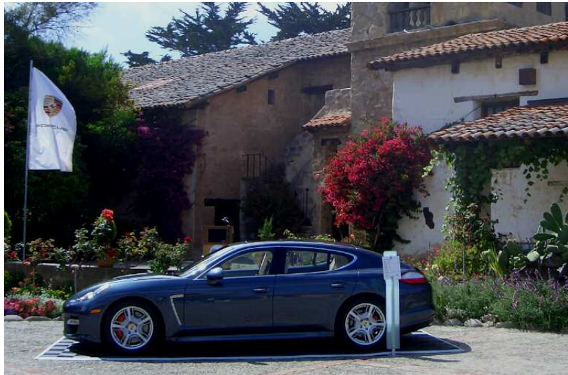
Première présentation de la Panamera au public américain

Pour Porsche Cars North America (PCNA), ce rassemblement de passionnés de voitures de sport était l'occa-