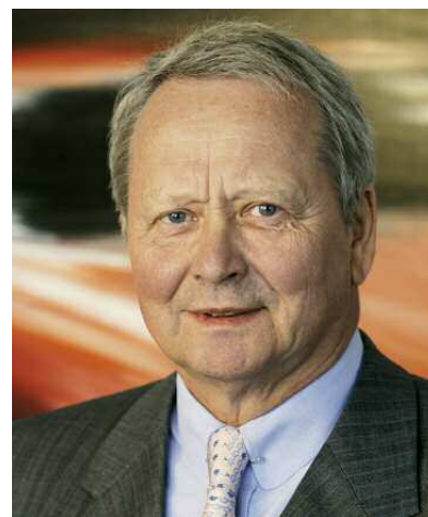
Dr. Wolfgang Porsche, Président du Conseil de surveillance

La fascination exercée par notre marque se reflète par ailleurs dans les manifestations organisées par nos Clubs. En cette fin d'année, nous pouvons faire le point sur de nombreux événements positifs. Je pense par exemple à la grande rencontre du Porsche Club Allemagne à Hambourg ou encore à la 54 ème Porsche Parade USA organisée à Keystone (Colorado) et qui a rassemblé 1700 participants. Sans oublier la Rencontre Internationale des Porsche 356 qui s'est déroulée cette année à Montreux au bord du lac Léman pour célébrer la présentation, en exclusivité mondiale, de la Porsche 356 à Genève il y a tout juste 60 ans. La liste des manifestations et défilés est longue, et malheureusement, je ne peux tous les citer ici. Mais je tiens à remercier toutes les personnes qui ont participé à l'organisation de ces rencontres. Et je suis im-