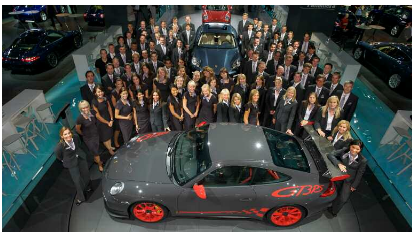
Compétence et savoir-faire : l'équipe Porsche au salon IAA

1200 entretiens conseil avec des personnes concrètement intéressées, 2200 invités VIP à huit soirées exclusives et d'innombrables réactions positives : Porsche Allemagne a remporté un vif succès au 63 ème salon international de l'Automobile de Francfort.