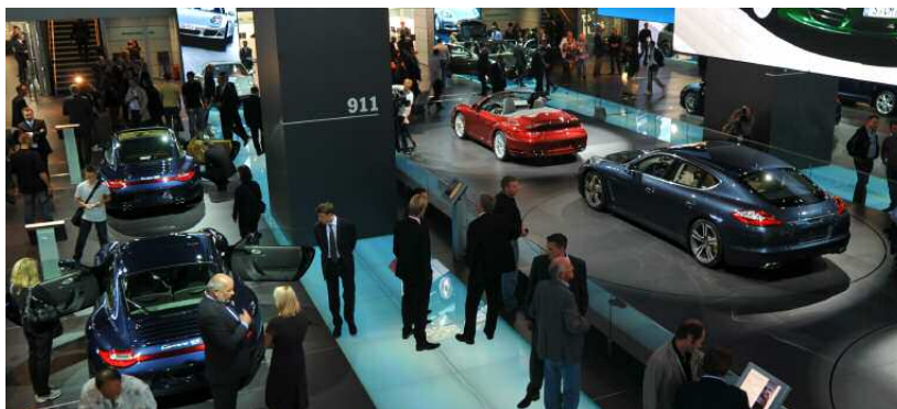
Des exclusivités mondiales sous le feu des projecteurs