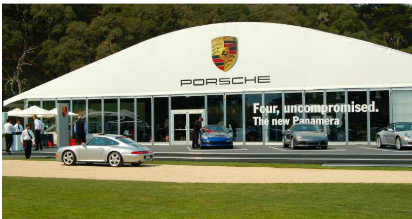
Puissance quatre : le chapiteau de présentation de la quatrième gamme Porsche à quatre portes