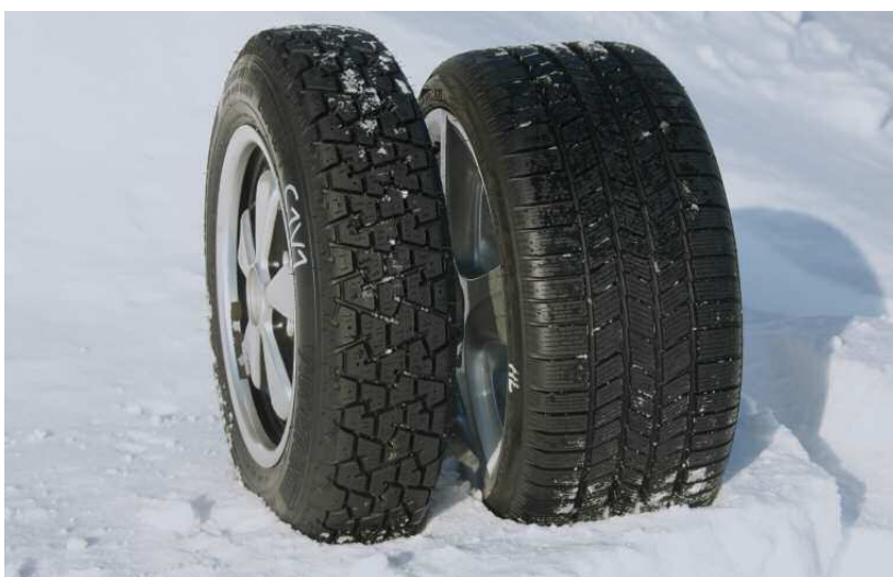
Porsche teste un large éventail de pneumatiques hiver

A cet effet, plus de 100 jeux de pneumatiques différents ont été testés au total dans les disciplines les plus variées, à des températures extérieures hivernales, dans la neige, mais aussi sur des chaussées humides et sèches.