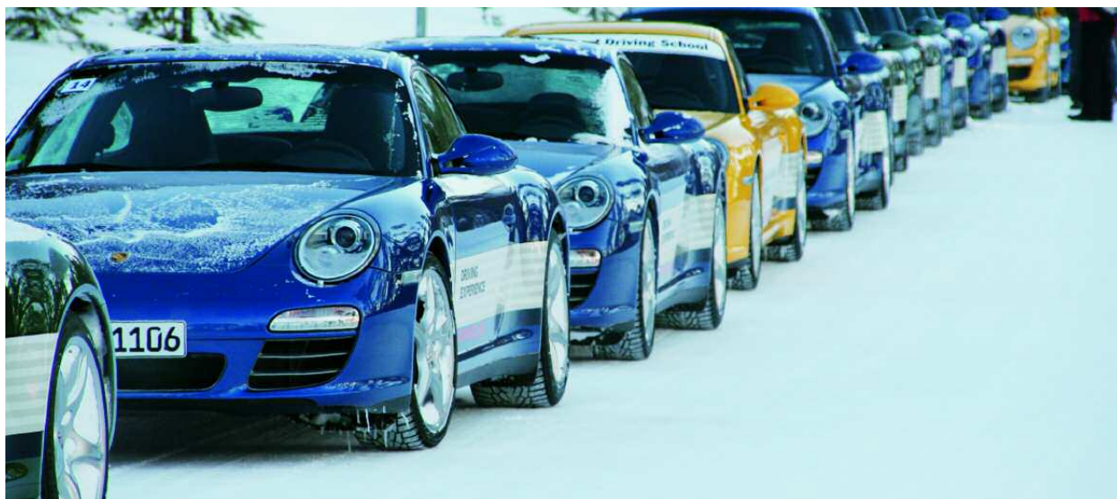
Plaisir de conduire et sécurité : la Porsche Sport Driving School