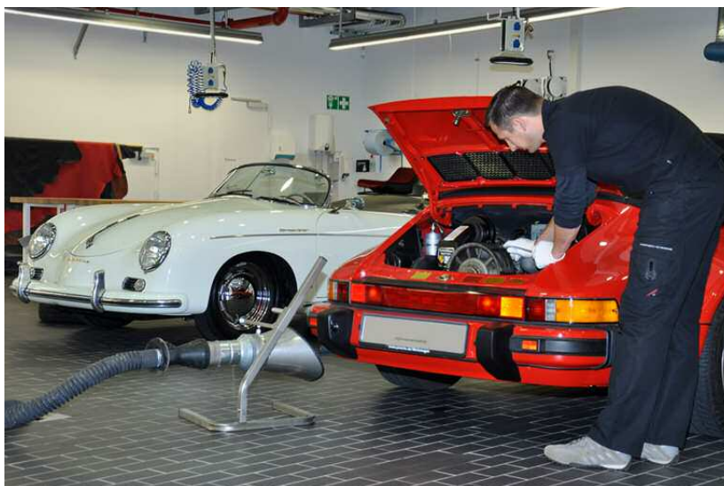
Dans l'atelier du musée Porsche, les véhicules sont restaurés dans les moindres détails

Cet atelier permet aux participants de contrôler, avec l'aide d'un expert, les travaux de restauration effectués. Nous vous montrerons comment tester le fonctionnement de toutes les pièces. Après la mise en place des sièges aura