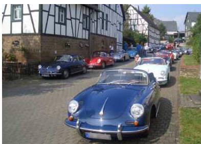
Un village entier sous le signe de la Porsche 356

Le programme du lendemain apportait pleine satisfaction aux amateurs de belles excursions : 230 km au total des plus belles petites routes d'Allemagne sous des roues au chrome éclatant. Un