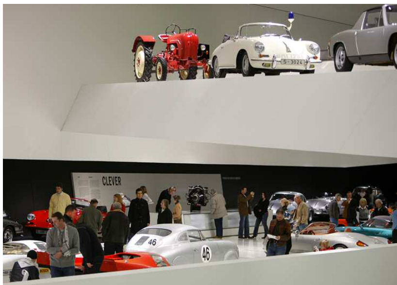
Le musée Porsche, une alliance réussie de tradition et de modernité

Au nom de tous les participants, je souhaite encore remercier de tout cœur la société Porsche AG pour son soutien remarquable en amont de la manifestation comme pendant la fête !