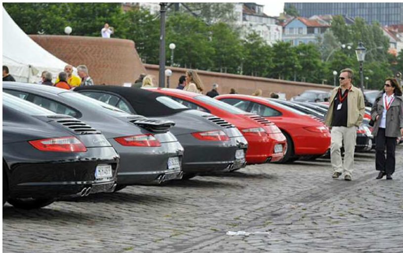
Le Concours d'Élégance sur la place du Marché au poisson

Le lendemain matin, le soleil hésitait encore à se mesurer aux éclats de lumière jetés par les bolides rutilants, en route pour le Concours d'Élégance organisé sur la place du Marché aux poissons.