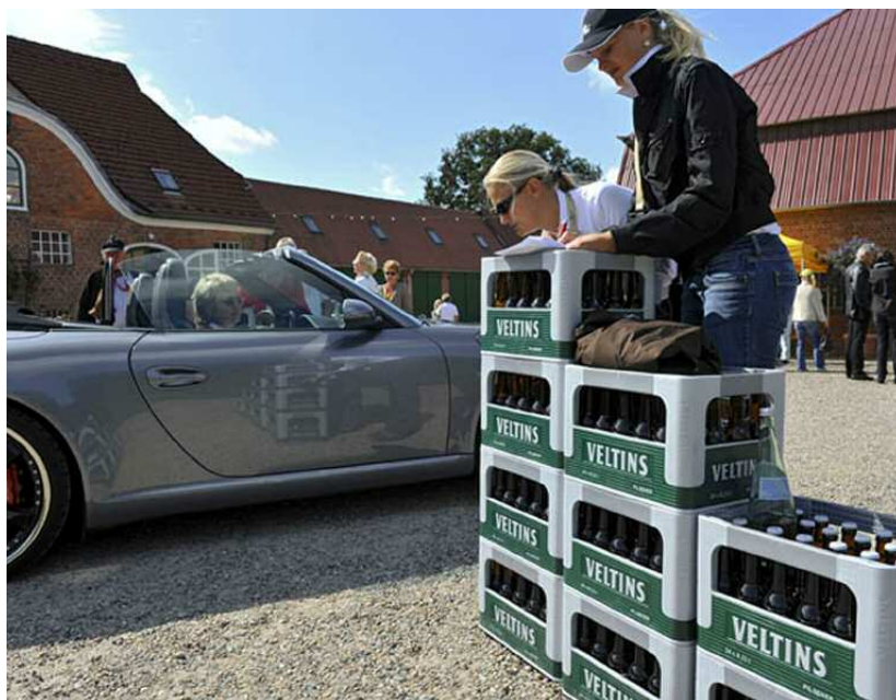
Des casiers qui ne servent pas qu'au rangement : rester dans la droite ligne avec le sponsor Veltns

A bord, la bonne humeur augmenta d'heure en heure et les « conversations automobiles » allaient bon train dans le navire de luxe. Vers 23h, il était temps de regagner les bus qui attendaient déjà en file les invités pour les ramener en tout confort à l'hôtel. Ensuite, bon nombre de conversations se poursuivirent au bar de l'hôtel.