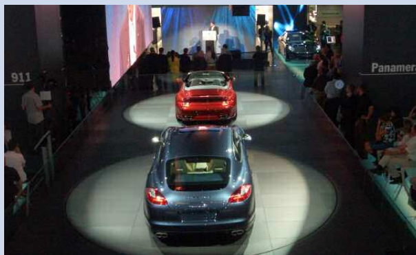
Un show d'exception réservé aux membres des Clubs