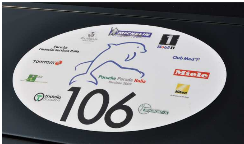
La première Porsche Parade d'Italie : une manifestation qui tourne rond !

La palette des modèles Porsche réunis pour l'occasion était des plus variées : des voitures anciennes telles que le 356 speedster, mais aussi des Boxster, Cayman, 911, Cayenne, et même des modèles sport GT2, GT3 et Carrera GT. Les participants eurent droit à une surprise dès la première soirée, avec un spectacle humoristique au programme. Mais les activités proposées dans le cadre du programme parallèle ont elles aussi comblé tous les participants avec, entre autres, un tournoi de golf dans un club renommé, une course de karting, ainsi qu'une visite guidée des grandes attractions culturelles de Rimini. La visite de la Comunità di San Patrignano, qui produit du vin célèbre dans toute l'Italie, a particulièrement enthousiasmé les