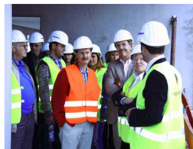
Lors de la visite du chantier à Sachsenheim

Le samedi matin, un petit-déjeuner copieux nous attendait en préparation à une visite de la ville de Stuttgart. Notre guide nous a présenté les curiosités de la capitale régionale avec tant d'humour et de passion, que nous aurions pu l'écouter pendant des heures. Mais il était déjà temps d'aller déjeuner. Au restaurant Ratskeller, au cœur de la vieille ville, un buffet de spécialités souabes attendait les invités affamés et impatients d'échanger leurs impressions.