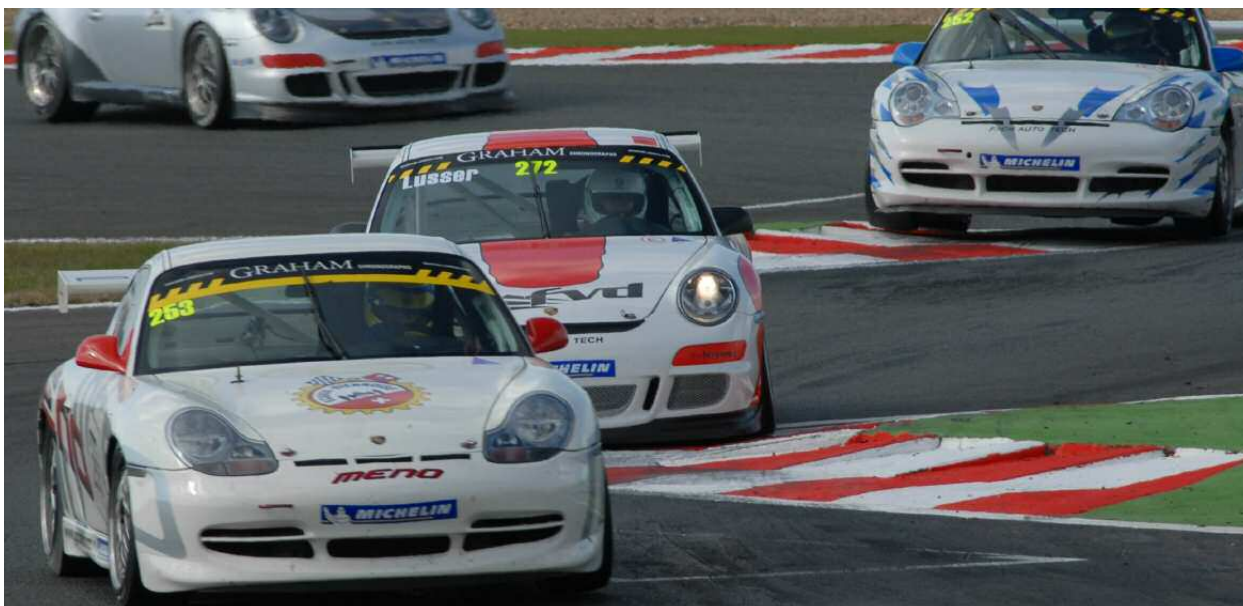
Sur la trajectoire idéale : la Porsche Sports Cup Suisse

Le suspens absolu était au rendez-vous de la 6 e et dernière épreuve de la Porsche Sports Cup Suisse, qui s'est disputée sur le circuit Grand Prix de Magny-Cours en Bourgogne.