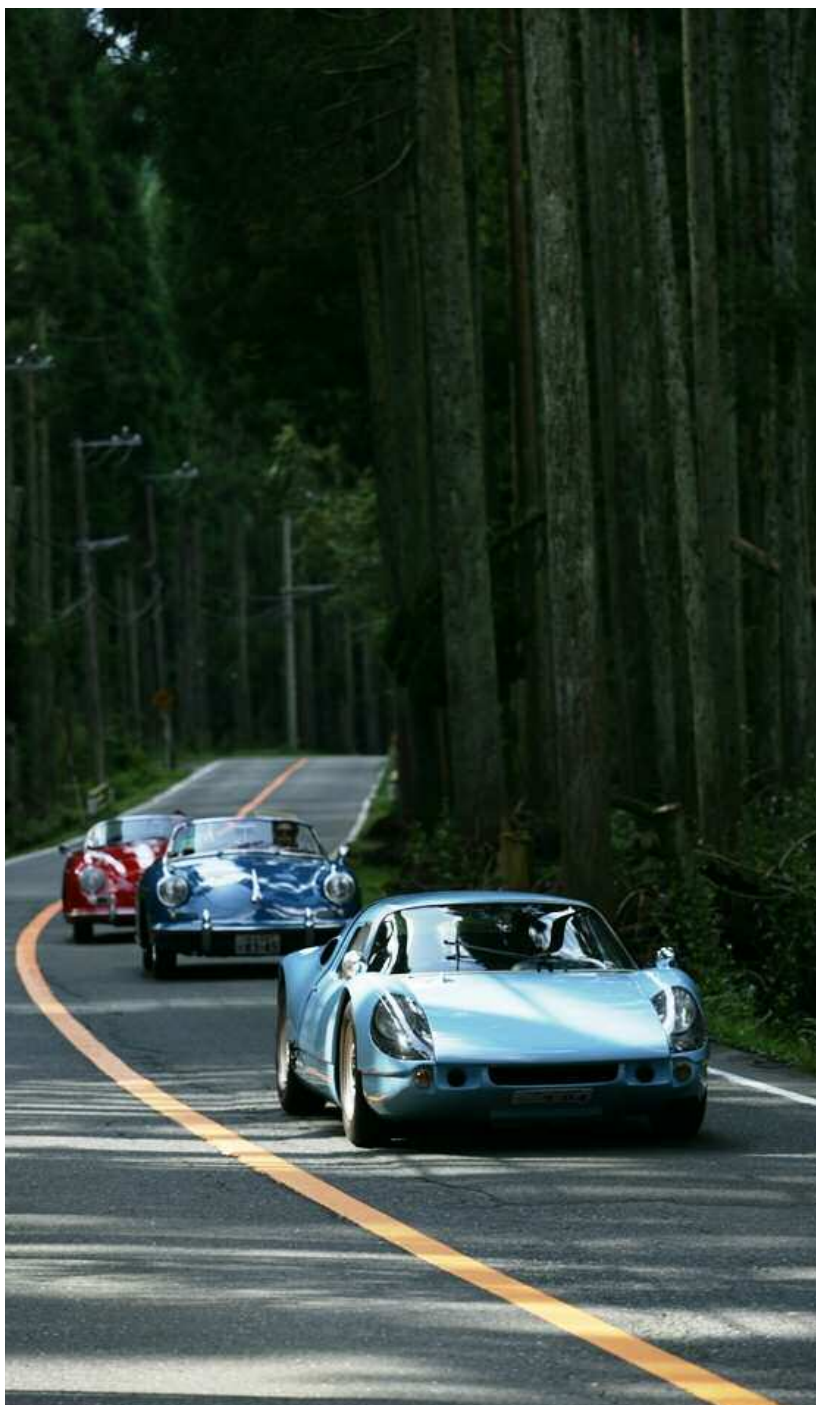
Les grands de ce monde : plusieurs Porsche 904 dans une forêt de séquoias

Les voitures très bien entretenues furent alignées pour le Concours d'Élégance et firent bien vite le plaisir d'un public enthousiaste. Il est rare, au Japon, de voir une telle concentration et un tel éventail de modèles Porsche classiques, dans les motorisations et les variantes de carrosserie les plus diverses : speedsters, coupés, roadsters, convertibles étaient alignés les uns à côté des autres, parfois accompagnés de raretés telles que la 904 Carrera GTS ou la Porsche 911 Carrera RS 2.7.