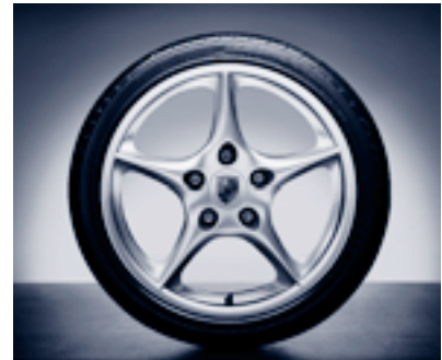
Jeu de roues d'hiver complètes N° de pièce pour les modèles 911 (Type 996, C2/C4 et GT3) : 000 044 600 87

La Roue en alliage léger 18 pouces Carrera filigrane met en valeur les freins Porsche. Malgré sa structure monobloc, elle est à peine plus lourde qu'une roue à rayons creux.