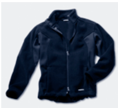
Un complément sport : La veste polaire noire pour messieurs • WAP 520 00S-XXL 15