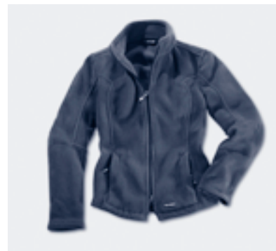
Coupe cintrée : La veste polaire pour dames plus près du corps • WAP 521 00S-OXL 15