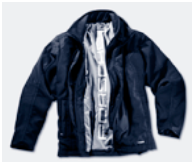
Une protection élégante : La veste qui saisit le vent au col. • WAP 510 00S-XXL 15

D'autres informations au sujet de notre gamme de produits Porsche Design Driver's Selection et de notre catalogue actuel vous seront fournies par votre partenaire Porsche local ou via Internet sur www.porsche.com