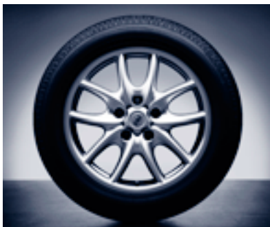
Jeu de roues d'hiver complètes 19 pouces Cayenne Design.

L'une des dernières productions Porsche Tequipment est un jeu de roues d'hiver complètes 19 pouces au design Cayenne attrayant. Les pneumatiques sont référencés pour une vitesse de jusqu'à 240 km/h.