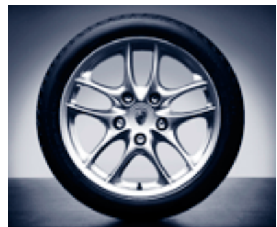
Jeu de roues d'hiver complètes 17 pouces Boxster S II N° de pièce pour les modèles Boxster (Type 986) : 000 044 600 84

La Roue 17 pouces Boxster S II , au dessin dynamique et sportif, n'impressionne pas uniquement sur le Boxster S.