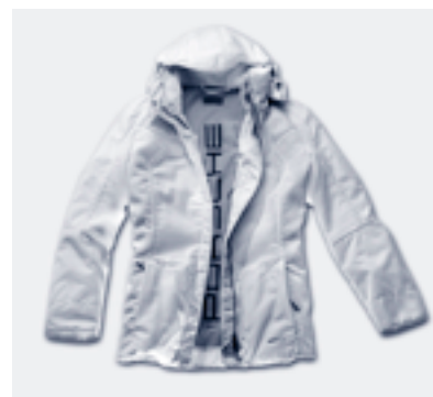
Tout en blanc : La veste GORE-TEX® pour dames à structure respirante • WAP 511 00S-OXL 15

La coupe cintrée se retrouve sur la veste polaire au look sport assortie, nantie de deux poches à fermeture éclair. La décente inscription Porsche en métal se marie élégamment au coloris gris foncé.