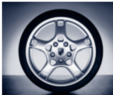
Jeu de roues d'hiver complètes 19 pouces Carrera S

Le dessin de la Roue 19 pouces Carrera S a vu le jour grâce à la combinaison de formes géométriques simples. Le résultat : un nouveau langage des formes très technique.