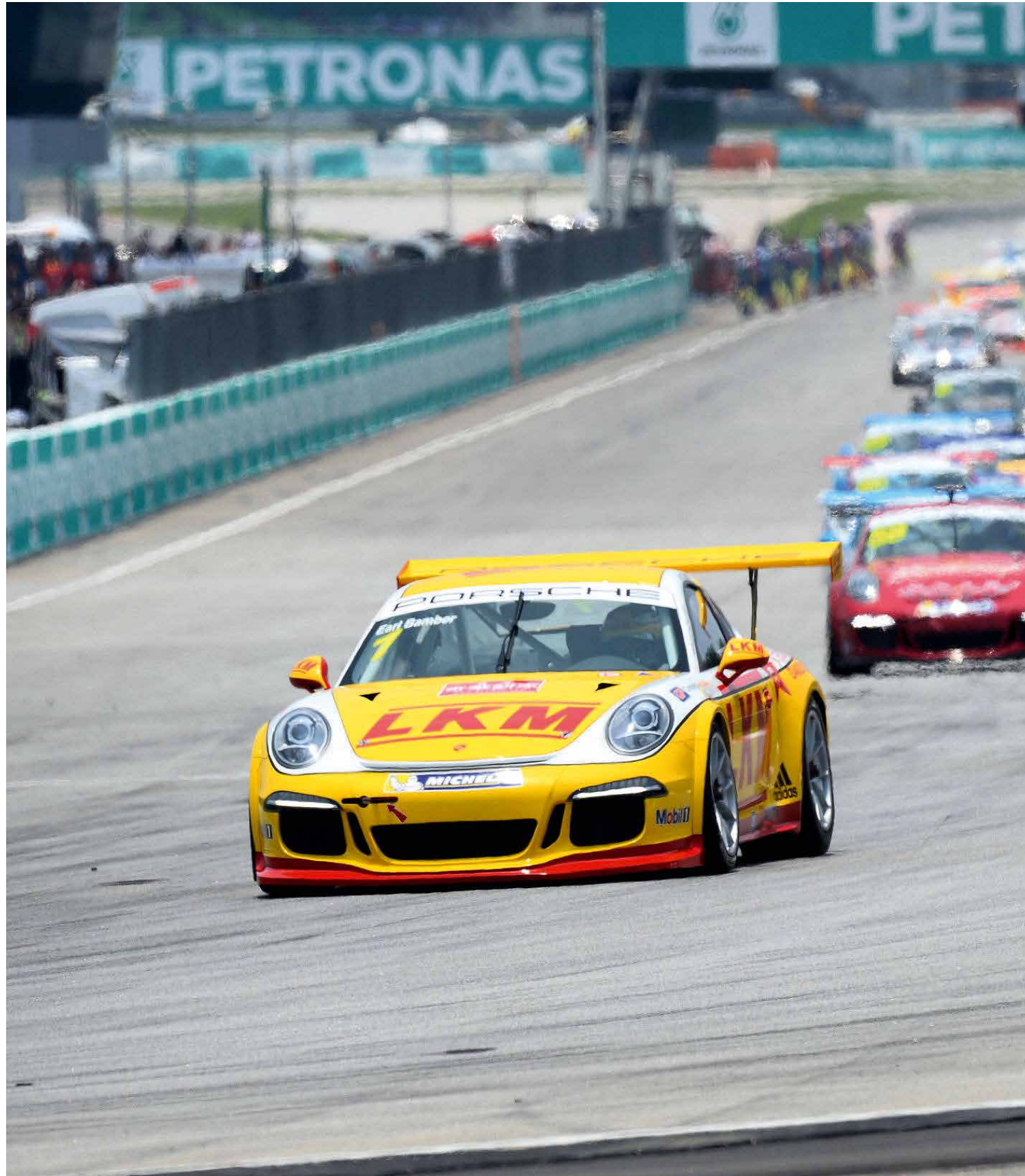
LKM Racing 车手班博在激烈的比赛中勇保杆位。