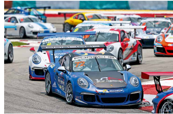
车手们在雪邦赛道的一个弯道中争抢有利位置。