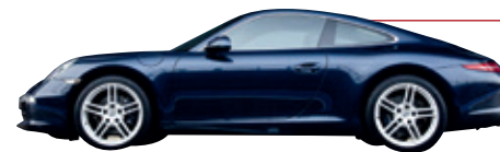
2011 年以来 911 (991)

由于车辆中的绝大多数部件都进行了重新设计或改良，最新一代的 911 所取得的突破非常明显。更长的轴距、更宽的轮距以及更大的轮胎，使得车辆性能和操控性均获得了极大的提升。