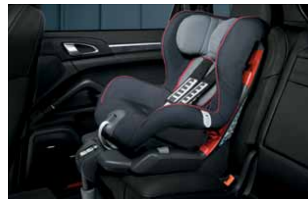
型号: Porsche Junior Seat ISOFIX, G 1 重量: 9 至 18 公斤 适用儿童年龄: 约 9 个月至 4 岁