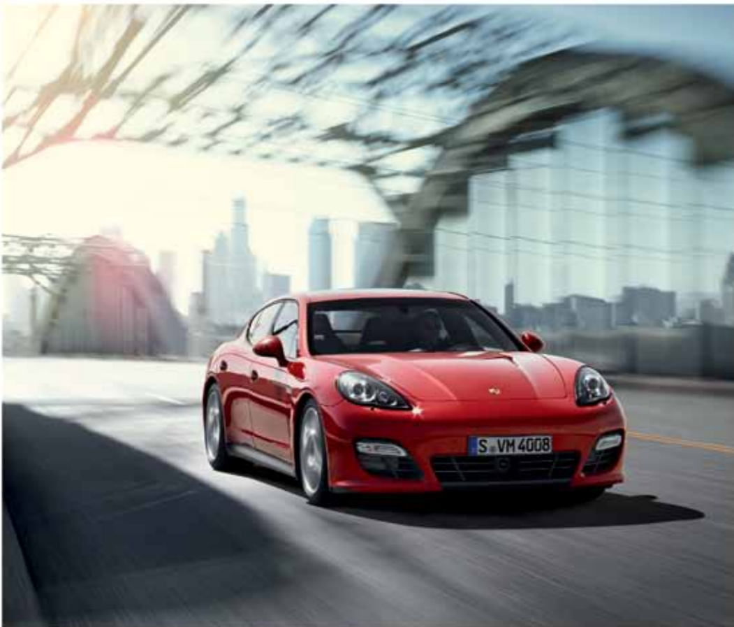
保时捷推荐 Mobil 1 请登陆 www.porsche.cn 了解详情