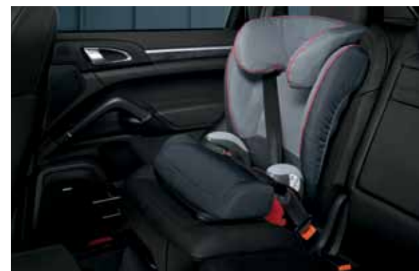
型号: Porsche Junior Plus Seat, G 2 + G 3 重量: 15 至 36 公斤 适用儿童年龄: 约 3 岁半至 12 岁