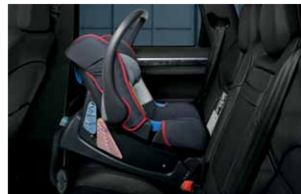
型号: Porsche Baby Seat ISOFIX, G 0+ 重量: 13 公斤以下 适用儿童年龄: 约 18 个月以下

我们始终把驾乘者的安全放在首位, 确保每一位乘员都能享受安全舒适的驾乘体验。保时捷儿童座椅特别关注小乘客的安全, 现在, 您可以全家出行无忧啦!