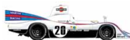
1976 PORSCHE 936 JACKY ICKX - GIJS VAN LENNEP 总里程数: 4,769.923 km 平均时速: 198.746 kph