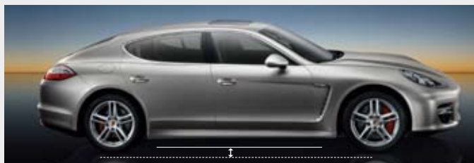
▲ 标准高度 - 根据德国工业标准, 系统处于标准高度时的车身最大离地间隙为 144 mm。