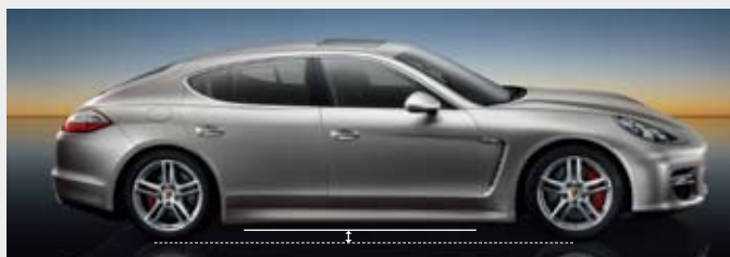
▲ 低位高度 - 比标准高度低 25 mm, 最大离地间隙为 119 mm。确保在运动驾驶方式下提供最佳抓地性能。