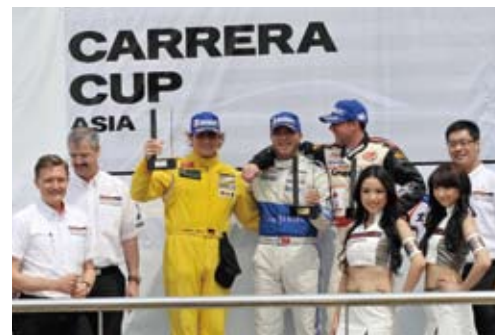
▲ 门泽尔、欧阳若曦和瑟肯在 2009 赛季中将为争夺冠军展开一番较量