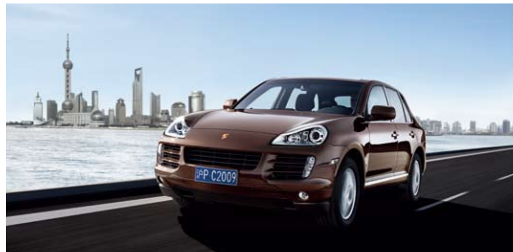
▲ 保时捷 Cayenne Edition Style 是首款专为中国保时捷爱好者推出的产品

此款中国专享车型的成功，标志着保时捷中国在其不断发展壮大历程中取得了一个新的成就，也体现出保时捷对中国市场始终不变的承诺。