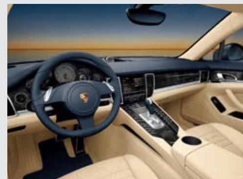
▲ Panamera 4S 的游艇蓝/乳白双色调内饰，搭配桦木饰件