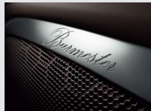
▲ Burmester® 高端环绕声音响系统