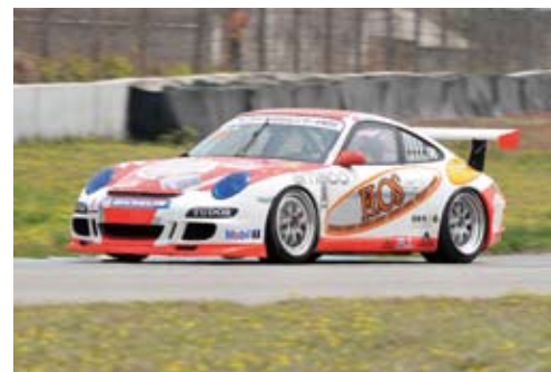
▲ 马清扬在 B 组中始终保持领先