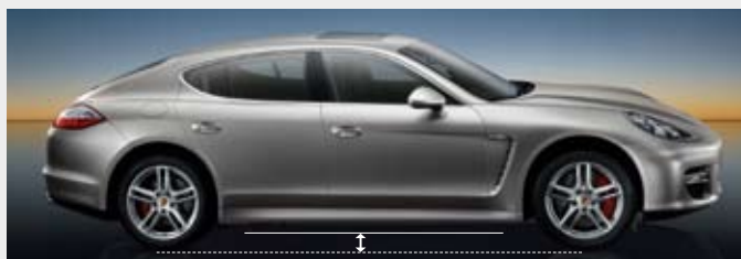
▲ 加高高度 - 比标准高度高 20 mm, 用于极端路况。一旦车速达到 30 km/h, 底盘自动恢复到标准高度。

全新 Panamera 车系标配了自适应气动悬挂系统, 包括自动水平高度控制以及行车高度和弹簧系数调节功能。无论载荷如何分配, 车身水平高度控制系统都能自动保持车身水平高度。手动行车高度调节功能可将车辆升高 20 mm, 从而将拖底风险降到了最低。选择 “Sport Plus” 底盘模式时, 车辆行车高度会自动调节到最低水平 (降低 25 mm), 气动悬挂系统则会设置到较硬的弹簧系数。只需按下按钮, 就能立即拥有运动型底盘。