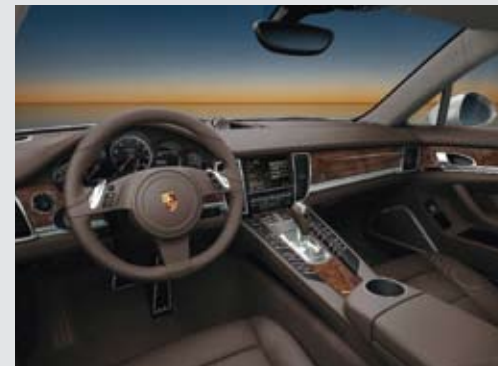
▲ Panamera Turbo 的深咖啡色天然真皮以及胡桃木内饰