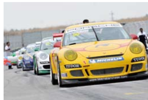
▲ 2009 亚洲保时捷卡雷拉杯延续了多年来的激烈战况

在2009亚洲保时捷卡雷拉杯余下的6个回合比赛中，争夺势必更加精彩刺激。在A组，欧阳、门泽尔和瑟肯可谓棋逢对手，冠军到底花落谁家还未可知。在B组，朱国明势必将力争在印尼站的比赛中卷土重来，与马清扬一决高下。无论在印度尼西亚和新加坡的比赛中将上演怎样的争夺战，中国的保时捷车迷们都可以于10月在上海举行的最后两个回合的比赛中，享受到引人入胜的视觉盛宴。