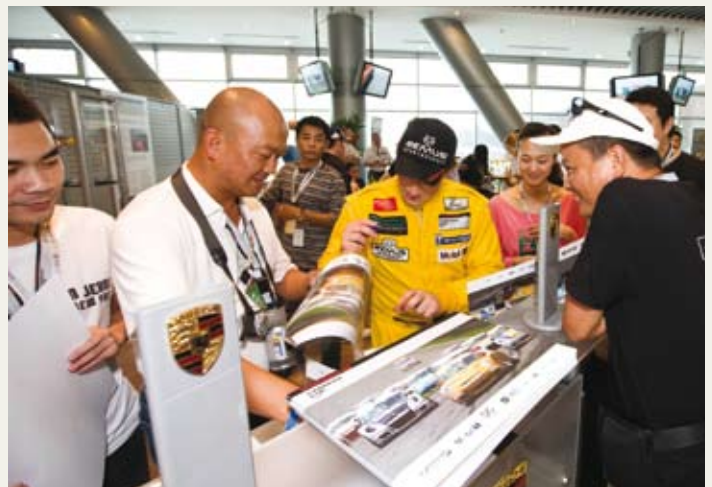
赛场动态：参赛车手和观赛贵宾度过了难忘的一天

宾们得以进入选手专区，一睹全新打造的保时捷 911 GT3 Cup 赛车，并与选手们交谈合影。他们除了体验保时捷以外，也深刻感受到了赛场紧张的气氛。