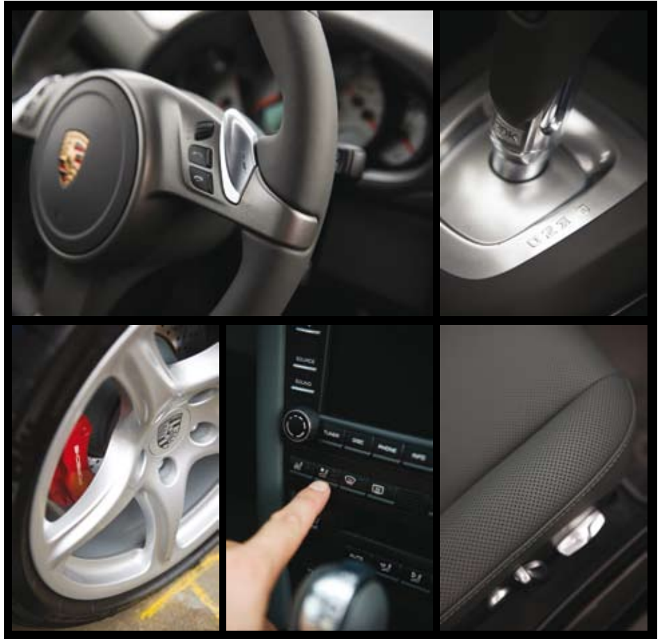
新款 911 的特写：PDK 方向盘（左上）和 PDK 选档杆（右上）

名为“操控”的环节则是最后的压轴大戏。嘉宾们开着新款 911 实战赛道，在多圈驾驶中全方位体验新款 911 的操控魅力。当然，保时捷教员们也不会放过展