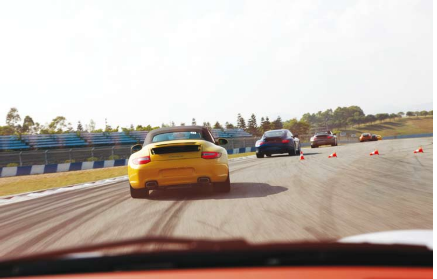
赛道上的全方位体验