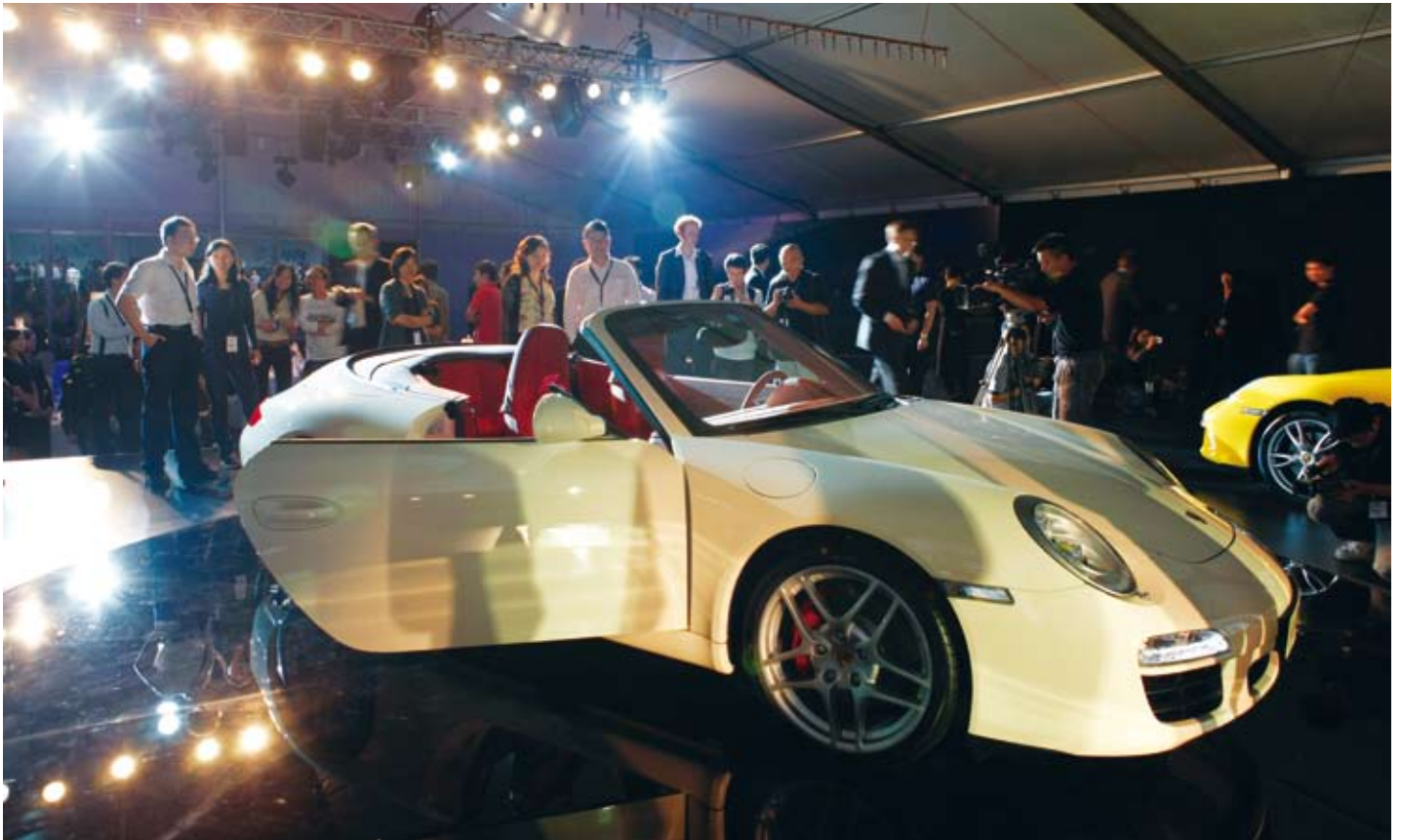
嘉宾抓紧机会近距离审视新款保时捷 911 的特色