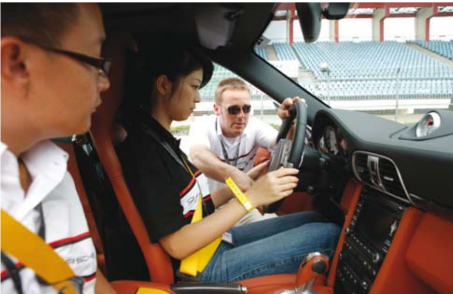
保时捷教员指点试驾来宾

现 911 强大潜能的最佳契机。他们以接近极限的最高车速飞驰赛道，向热血沸腾的嘉宾们展现了新款 911 在专业人士的手中可发挥出何等优异的性能，直让人惊呼连连。