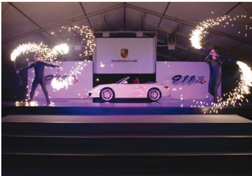
晚会上的主题舞蹈

当然，在这样的接触前，了解保时捷 911 的成长历史更有助于嘉宾们感受它所带来的种种新意与体贴，也可以为之后与它进行更为深入的交流打下基础。保时捷（中