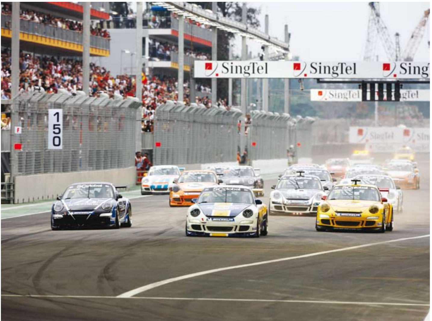
第九轮比赛中车手们在新加坡赛道上纵情驰骋

在起步阶段, 瑟肯就加大马力, 取得了较大领先。但在一个弯道上, 他的赛车失去控制, 滑出了赛道, 不走运的他再次丢失了领