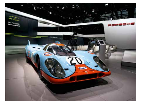
传奇赛车保时捷 917 Gulf 也到场为 918 Spyder 的亚洲首秀助威。

无论对于保时捷本身还是车迷而言，本次车展都是一次巨大的成功。庞大多样的参展阵容体现了保时捷始终坚持追求跑车工艺与日常实用性的完美融合。而正是这两大特性，让保时捷始终立于全球顶级汽车制造商之列。