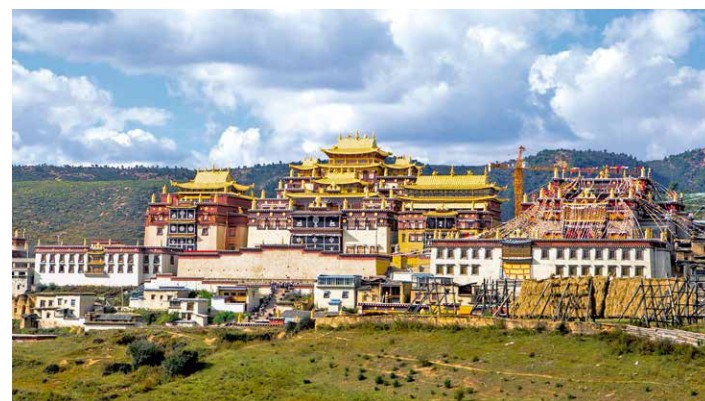
松赞林寺是云南最大的藏传佛教寺庙。