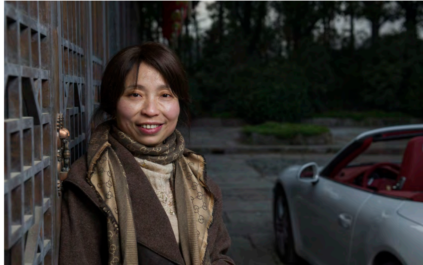
对于谢女士来说，911 是一种纯粹的艺术形式，细腻优雅。

然鲜少开车，但他就是对这部车喜爱有加。在他的眼里，这绝对是件地地道道的艺术品。”谢女士回忆道，“而自从看到这部车之后，它的那种视觉上的冲击力就一直在我的脑海里挥之不去。”因此，一回到家，她就立即从南京保时捷中心订购了一台白色车身、红色顶篷的 911——甚至连试驾都免了。基于以往的 Panamera 驾驶体验，谢女士完全相信，这部 911 的性能表现定会于它的外观设计一样超凡出众。