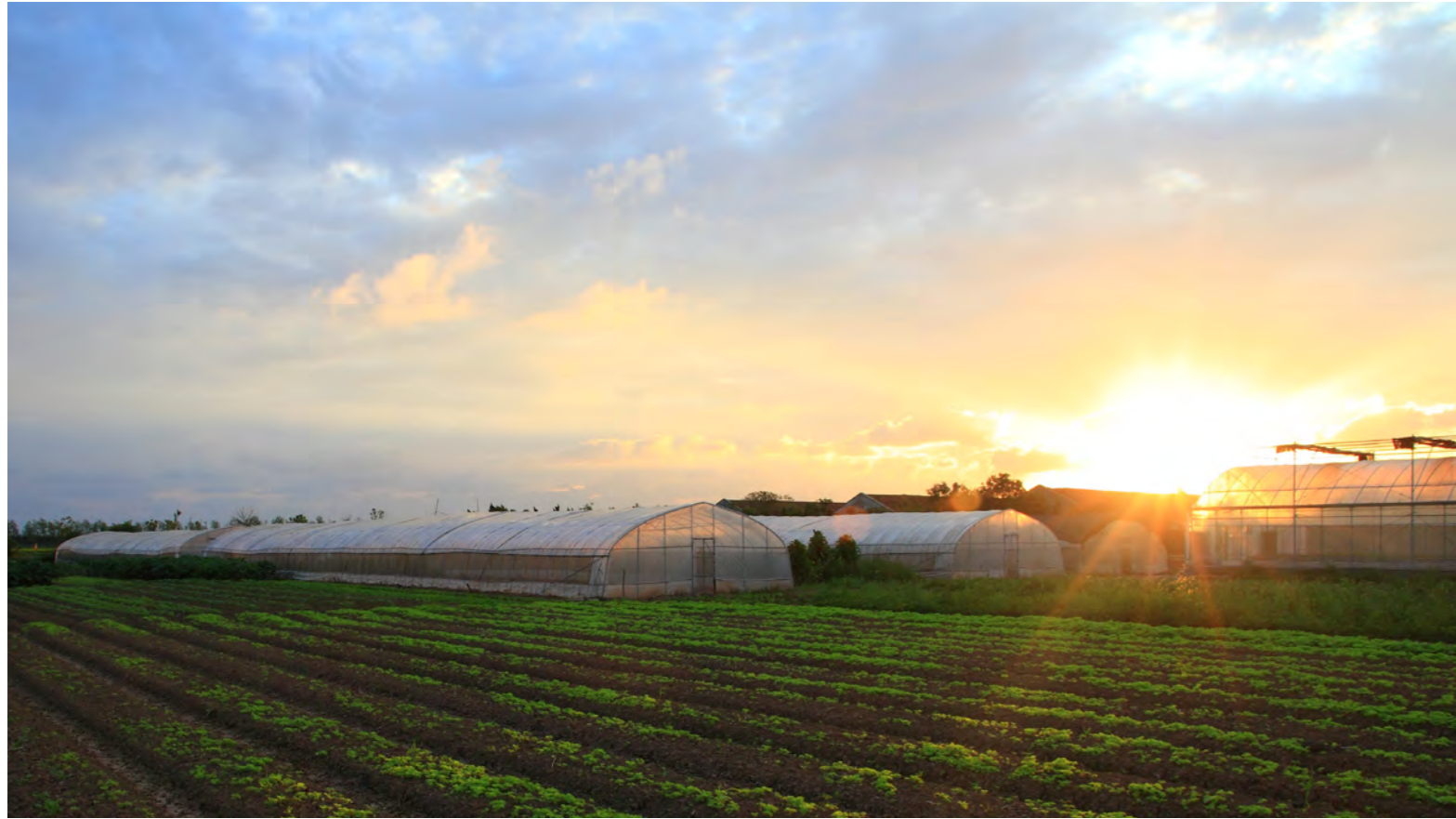
上海泰生有机农场田园诗般的晨景。