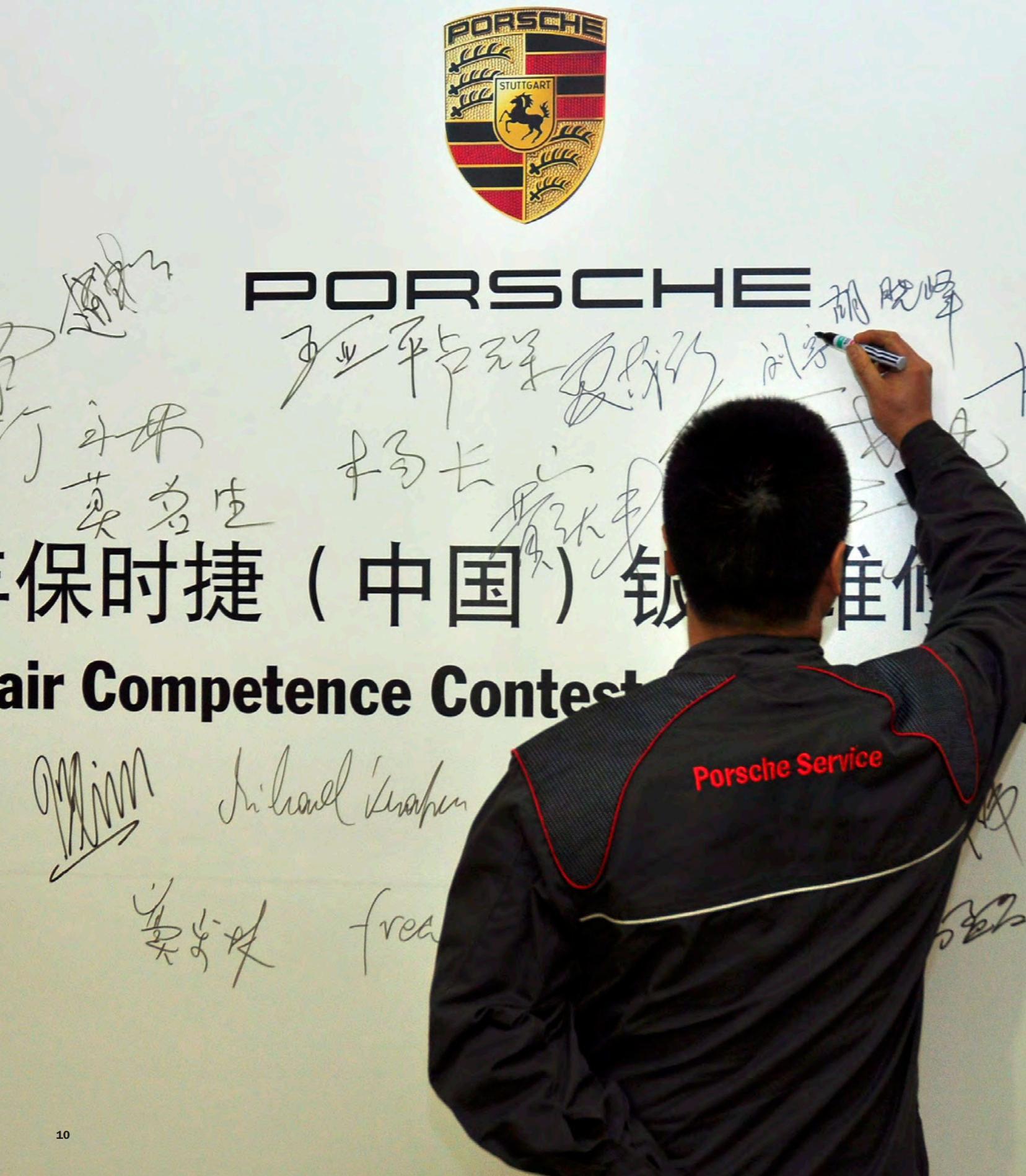
在竞赛结束后的颁奖晚宴上, 十位优胜者受到表彰, 激励所有参赛者再接再厉。