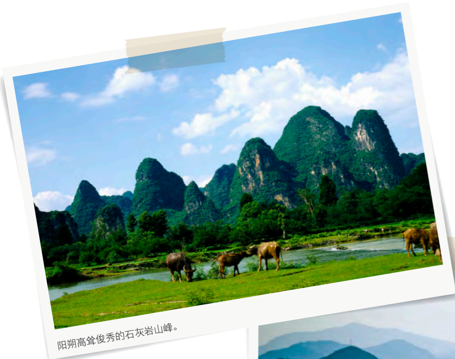
阳朔高耸俊秀的石灰岩山峰。