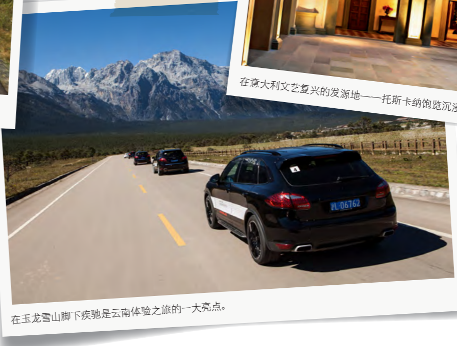
在玉龙雪山脚下疾驰是云南体验之旅的一大亮点。