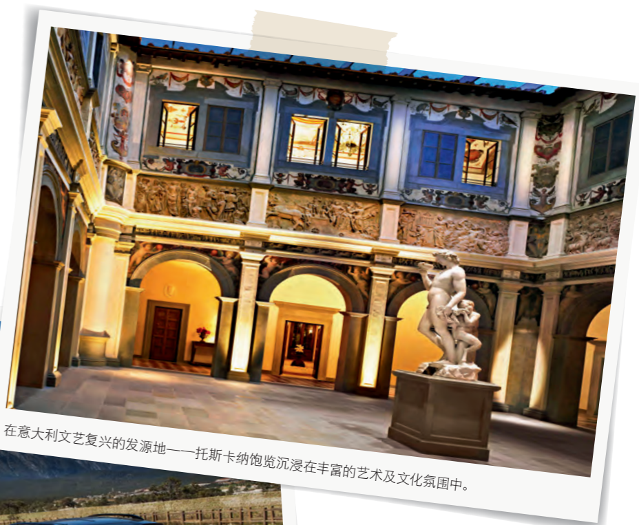
在意大利文艺复兴的发源地——托斯卡纳饱览沉浸在丰富的艺术及文化氛围中。