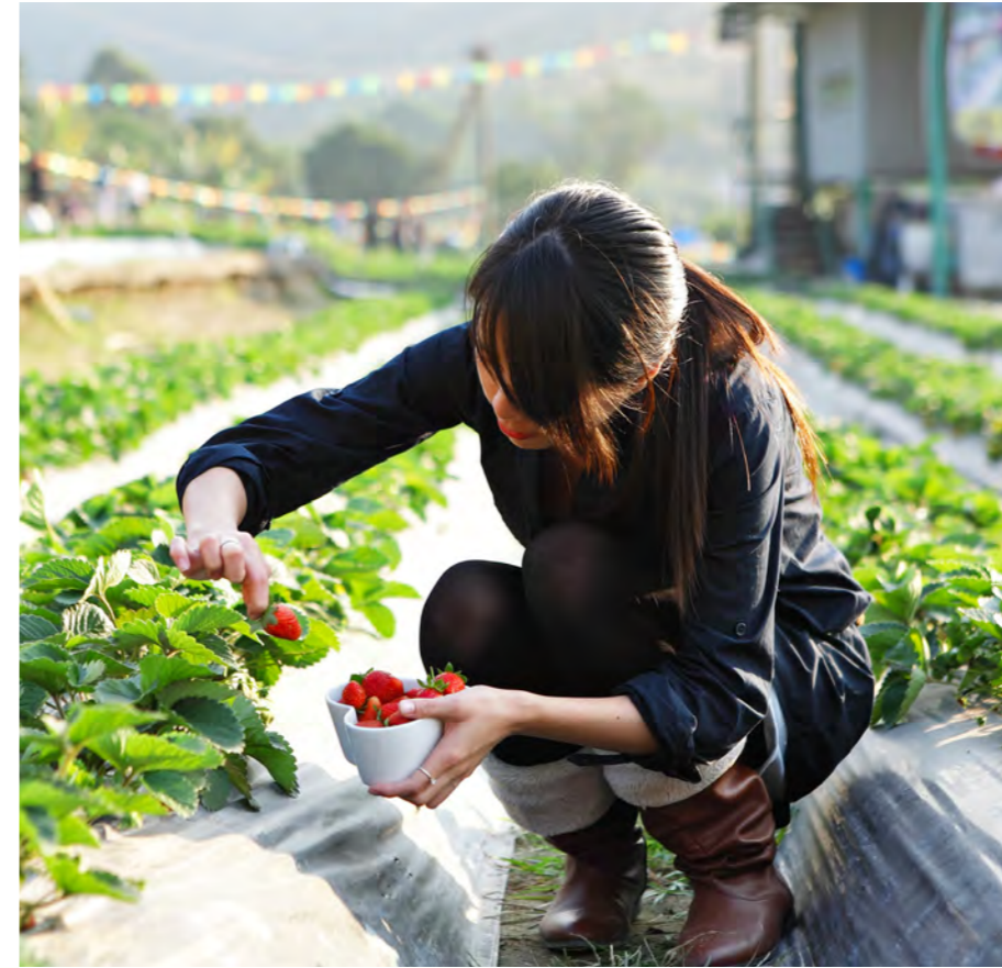
亲近大自然，享用其新鲜健康的馈赠。

“在种植果蔬、饲养牲畜时减少使用化学肥料，不仅于我们人类有益处，同时，也保护了地球，土壤、空气和水。” Sprout Lifestyle 的健康营养顾问金伯利·阿什顿 (Kimberly Ashton) 指出。“此外，有机食品都是当季成熟的，我们的饮食就应当遵循大自然的规律，什么季节吃什么菜，做到新鲜、营养。”