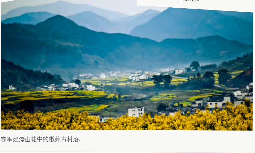
春季烂漫山花中的徽州古村落。