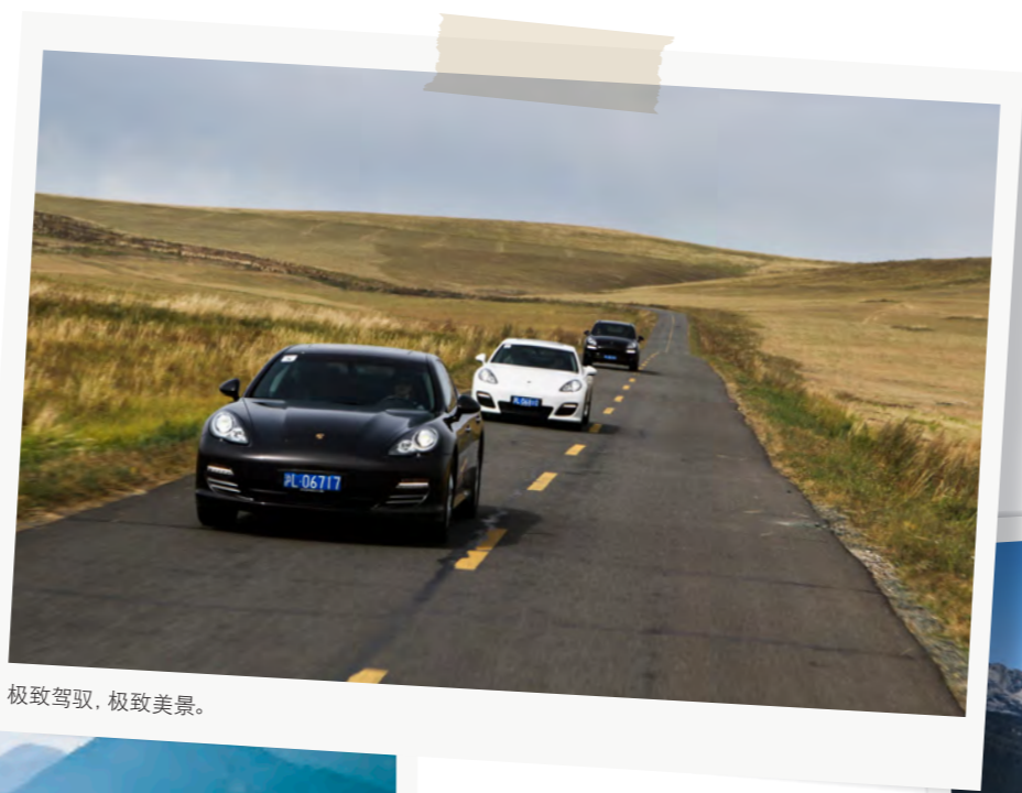
极致驾驭，极致美景。