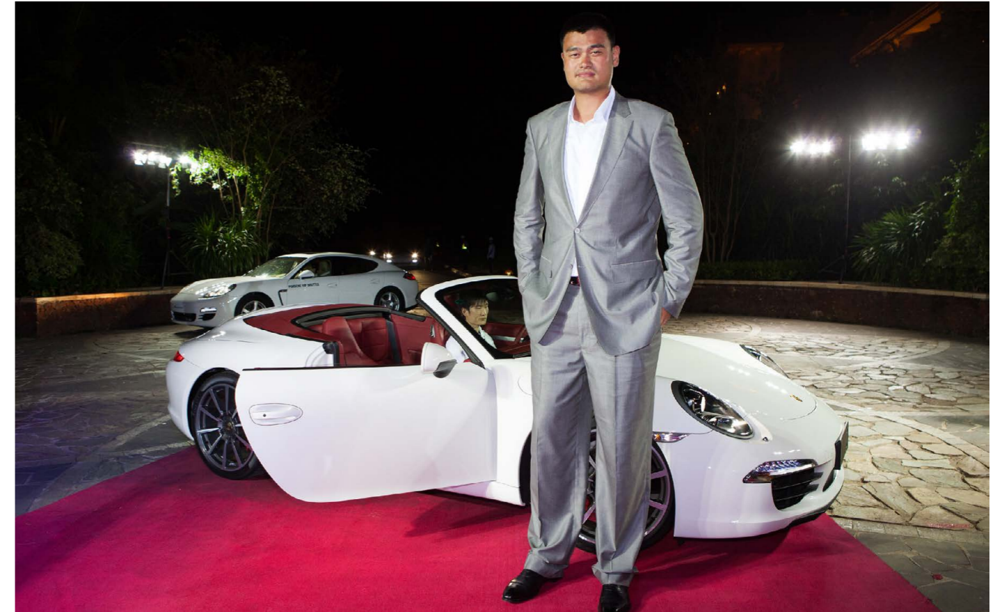
观澜湖世界明星赛的现场明星云集，姚明是其中之一。

融合了创新科技和突破性设计的标志性车型实现了与保时捷经典传统的完美结合，对于战胜挑战的优胜者来说，它是最适合不过的奖励。