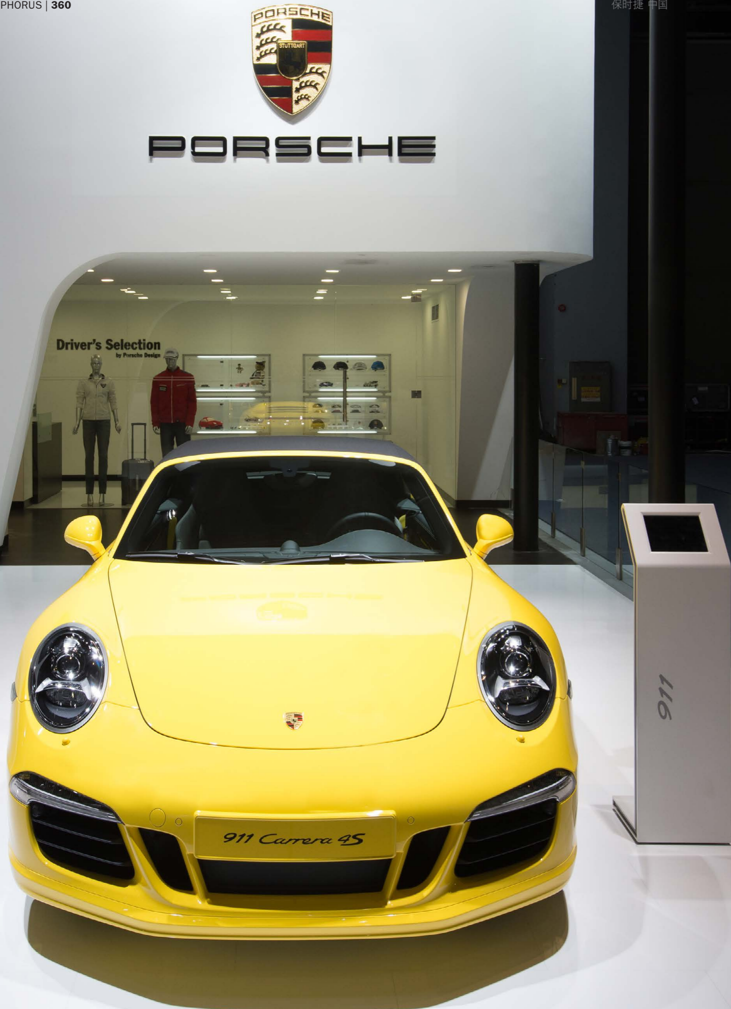
2012 广州车展保时捷展台。保时捷车型系列熠熠生辉。