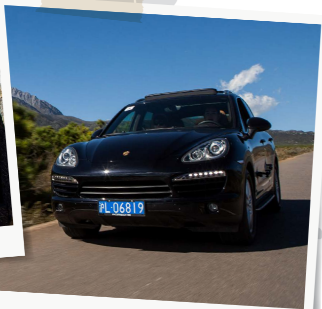
无边美景, 极致的驾乘乐趣。