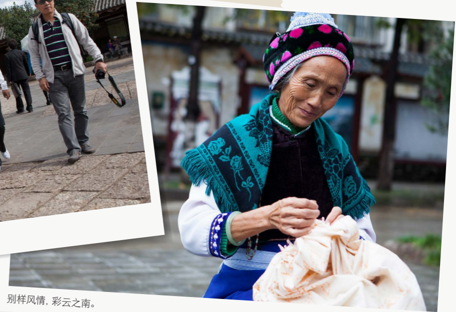
别样风情, 彩云之南。