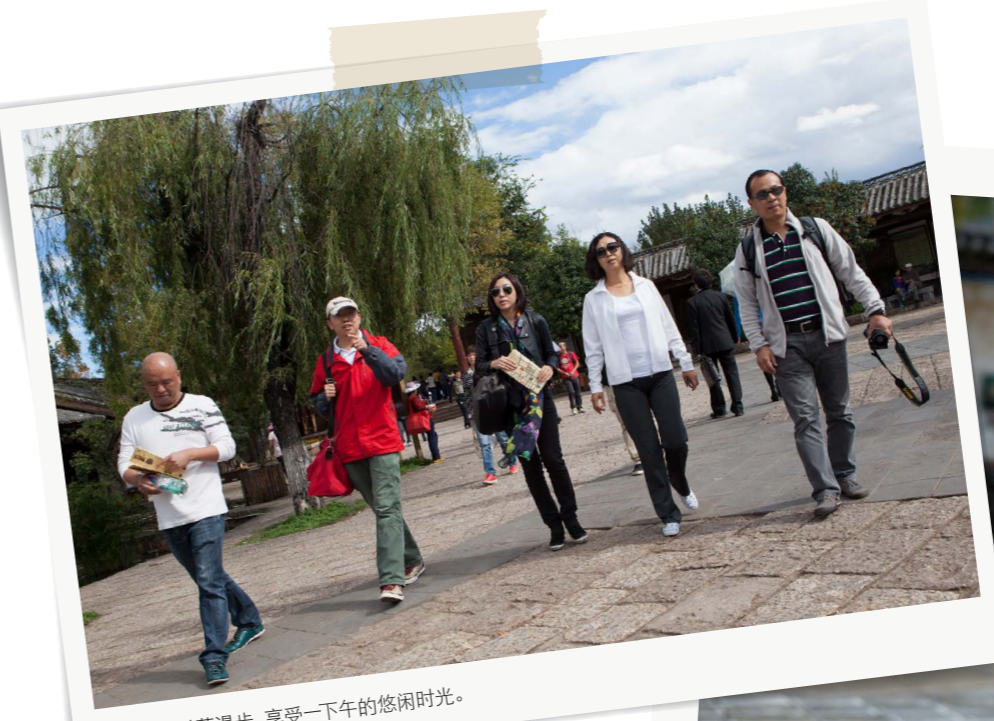
在束河古村落漫步, 享受一下午的悠闲时光。