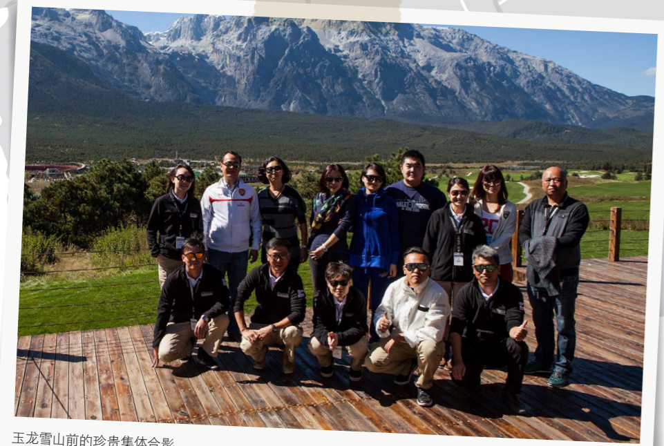
玉龙雪山前的珍贵集体合影。

从创立至今, 保时捷旅行俱乐部在十余年来组织了一次又一次令人难忘的驾驶之旅, 与参与者们一同游历了欧洲的名胜壮景。2012年, 我们不仅首次带领中国的旅行爱好者驱车饱览了海外风光, 更是为他们倾力打造了精彩的国内驾驶线路。继内蒙古之旅圆满结束后, 在2012年10月, 保时捷旅行俱乐部再度启程, 向着地处西南的云南省进发。在为期四天的驾驶旅程中, 保时捷车友们在经验丰富的驾驶教练的引领下, 驾驶着动感无限的 Cayenne 充分领略了沿途的山川胜景和古镇魅力。