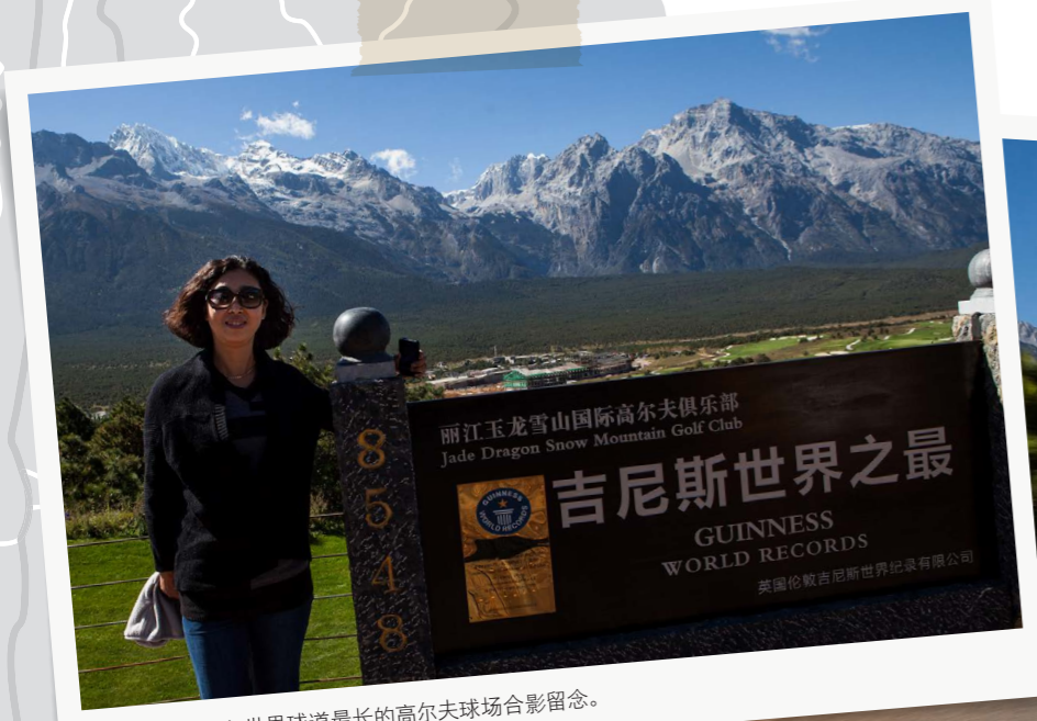
玉龙雪山山脊。与世界球道最长的高尔夫球场合影留念。