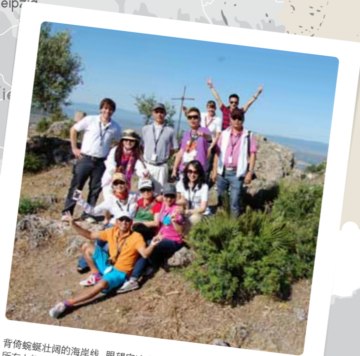
背倚蜿蜒壮阔的海岸线，眼望安达卢西亚巍峨耸立的山峦，所有人都感到心旷神怡。