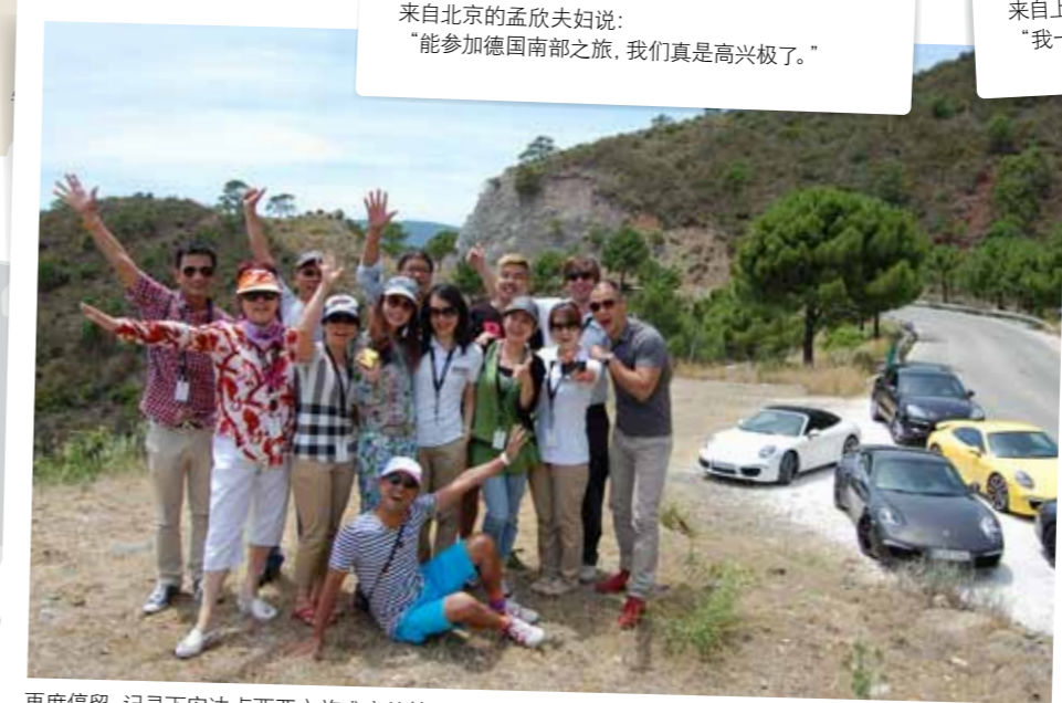
再度停留，记录下安达卢西亚之旅难忘的精彩时刻。