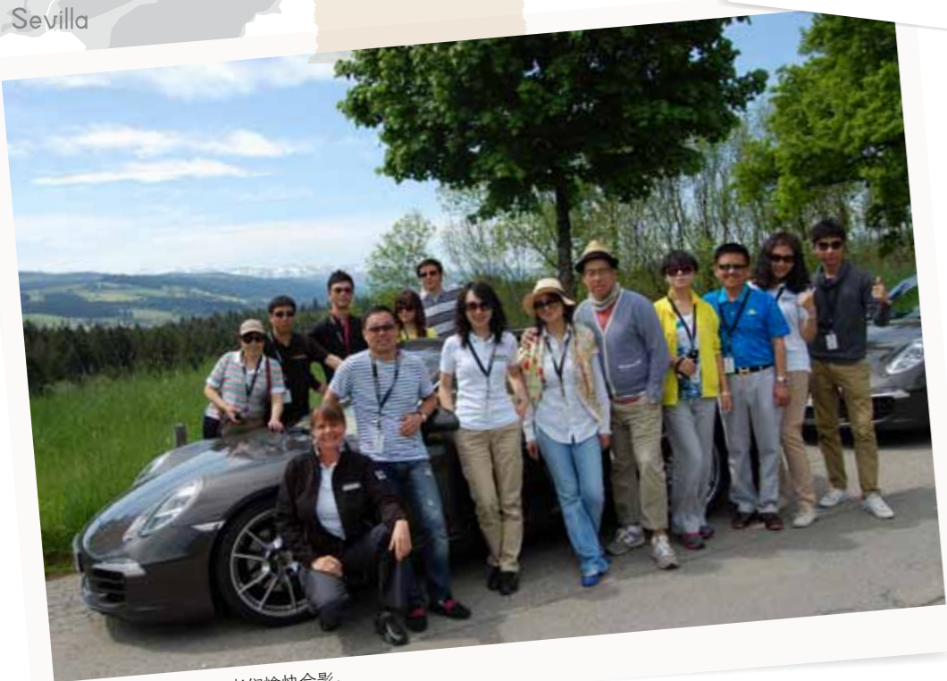
德国南部之旅中的参与者们愉快合影。