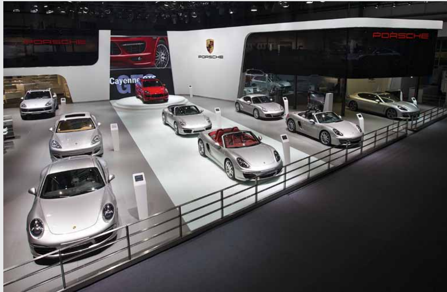
2012 北京车展保时捷展台一览图。一系列融合了当今尖端科技的新款车型使其成为本届车展最炙手可热的展台之一。