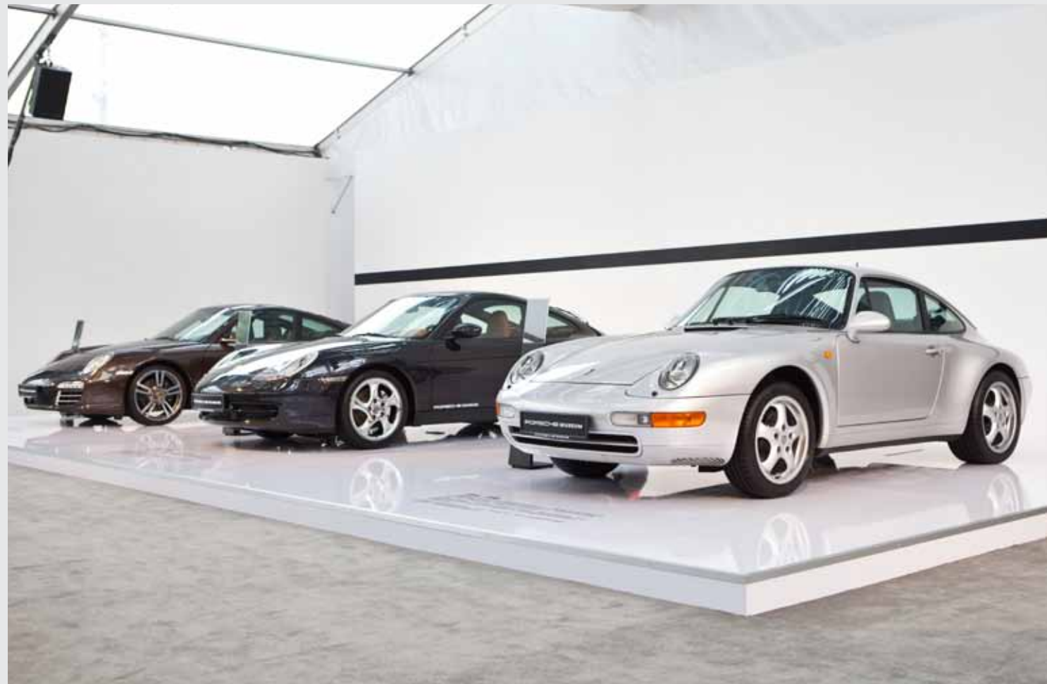
新款 911 全国发布会上，从德国保时捷博物馆空运而来的前 6 代 911 车型也在展览之列，生动地向来宾们展现了 911 的历史演变。

在谈及对中国市场的承诺时，柏涵慕先生还表示：“我期望能让越来越多的忠实车主和车友深入体验代表保时捷的品牌精髓及个性的新款 911。”