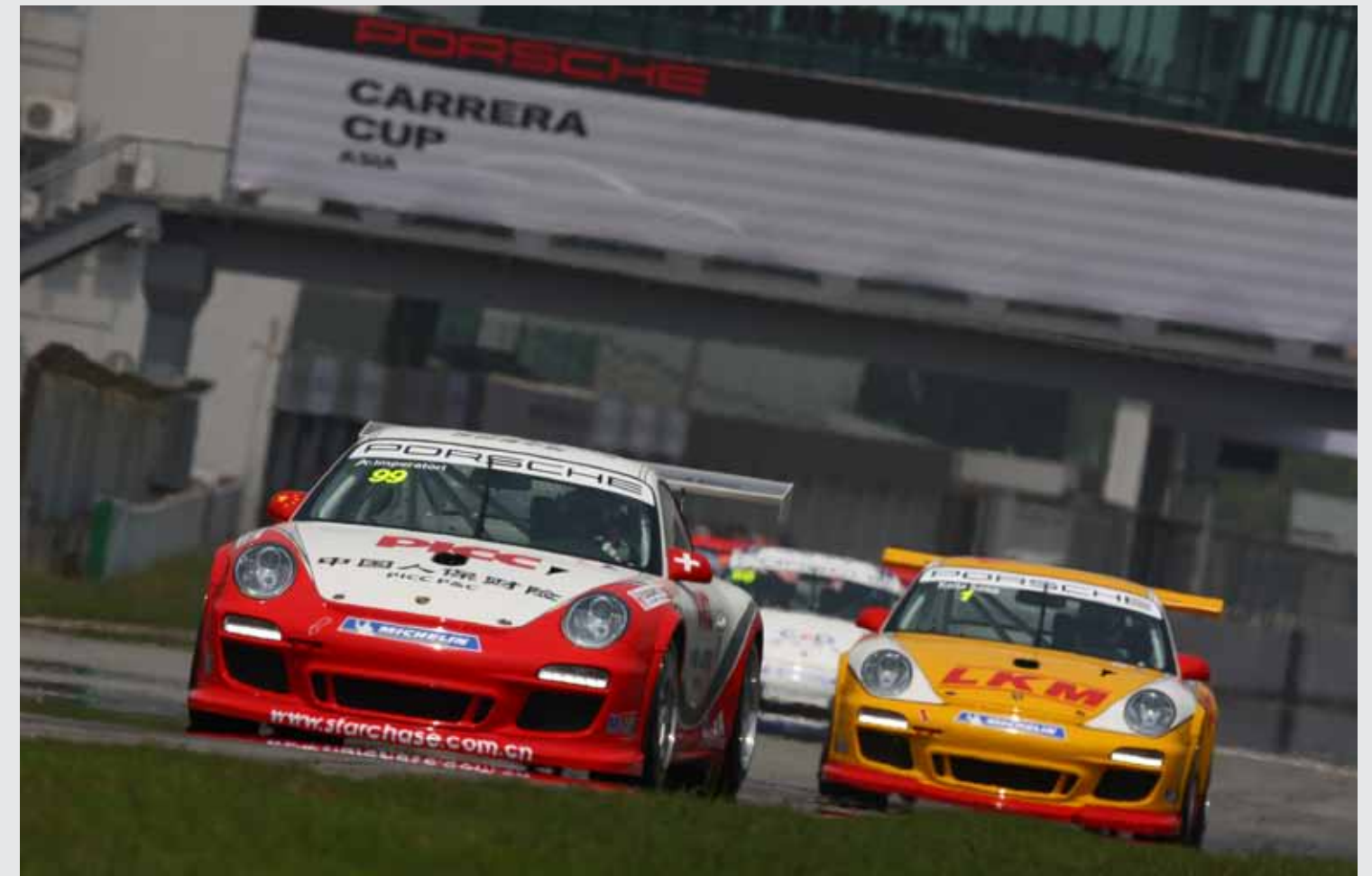
珠海试车日，众位车手在珠海国际赛车场温习赛车和赛道，为即将开战的第十赛季做准备。