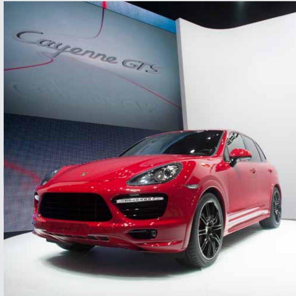
Cayenne GTS 的全球首发无疑是 2012 北京车展的一大亮点。

文 黄凝