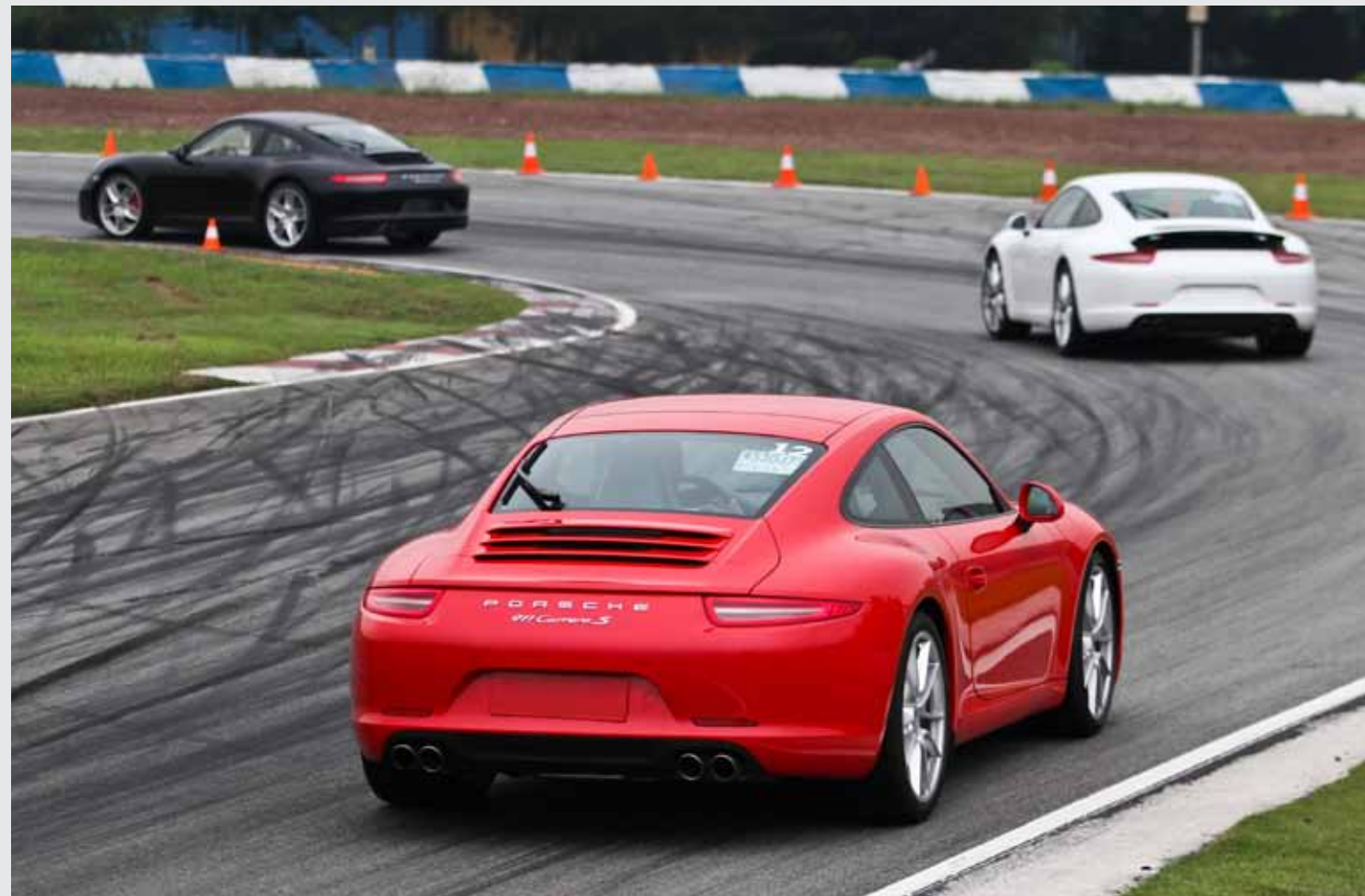
来宾们在珠海国际赛车场试驾新款 911，成为中国首批体验这款跑车传奇的幸运者。

而在珠海国际赛车场上，他们则进一步得到了隐藏在新款 911 外表下的非凡性能。在专业驾驶教练的引导下，来宾们通过在赛道上激动人心的绕桩环节，深入体会了新款 911 由全新设计带来的性能方面的强大提升。