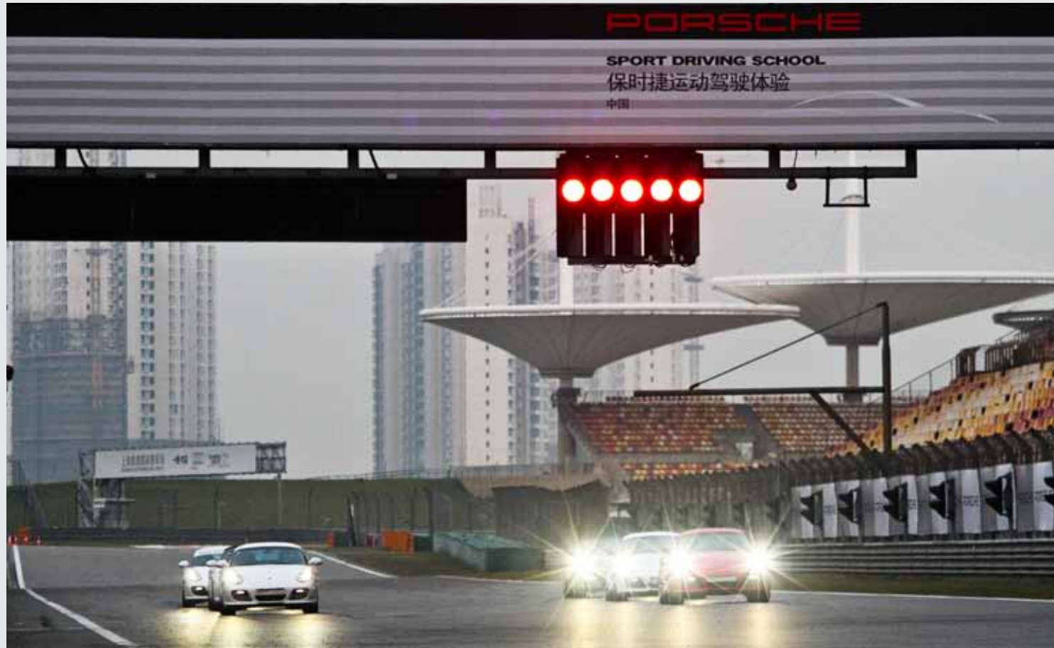
上海国际赛车场的终点直道。