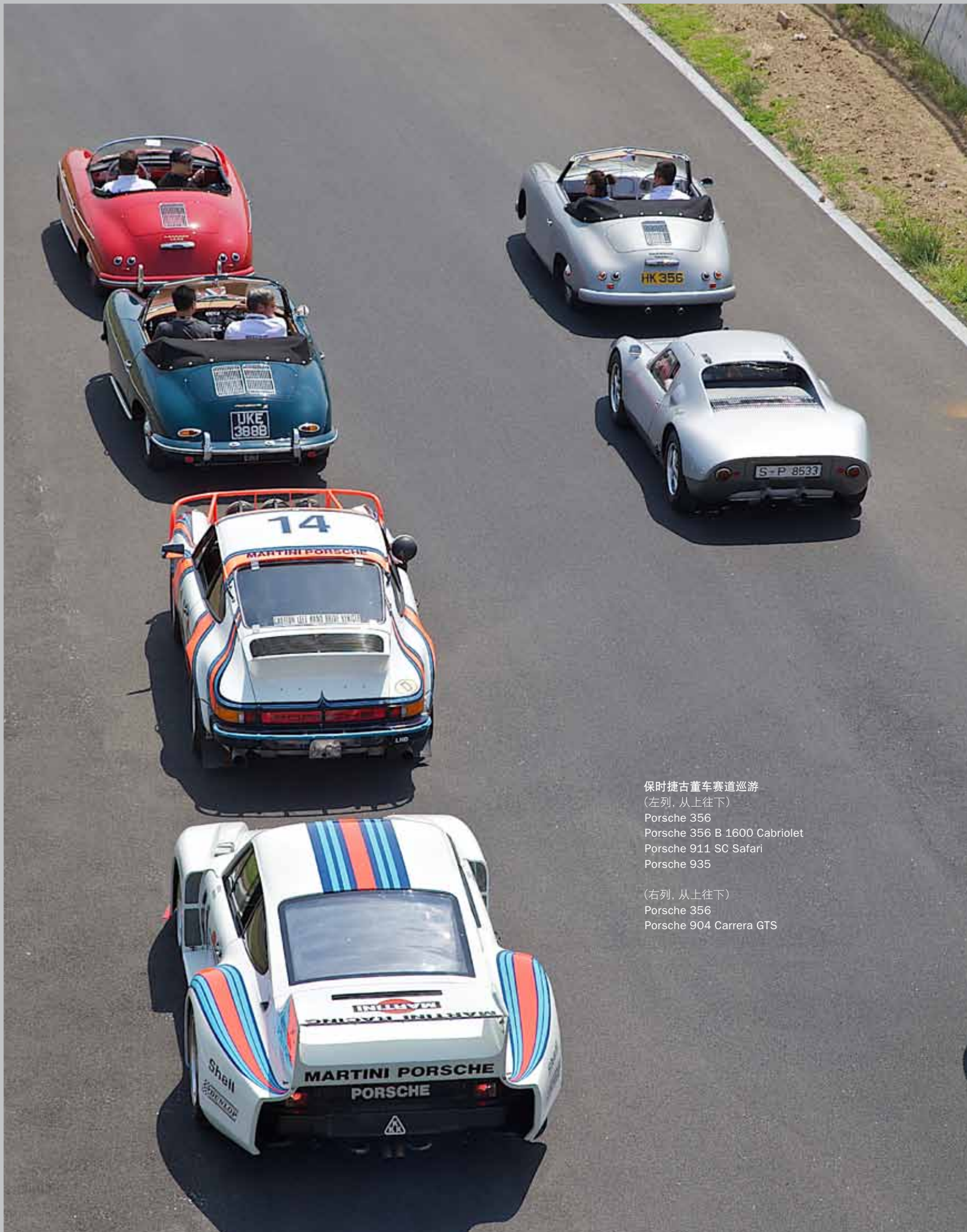
保时捷古董车赛道巡游 (左列, 从上往下) Porsche 356 Porsche 356 B 1600 Cabriolet Porsche 911 SC Safari Porsche 935