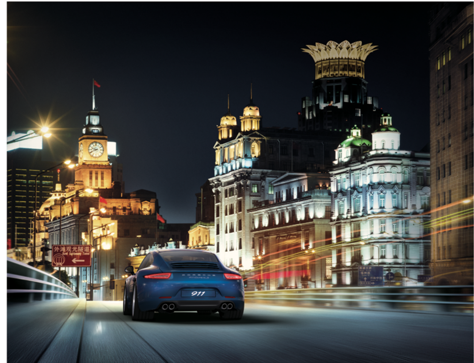
保时捷推荐 Mobil 1

王: 其实我没有考虑过它是否符合我的身份，只是觉得情有独钟。保时捷给我传递的信息很强大，其精湛的工艺，对细节至臻完美的追求，很契合我的生活理念。如今这部 911 给我的感觉，用英文来说，就像是一位 soul mate (灵魂伴侣)，我与它之间已经有了形影不离的默契。 ●