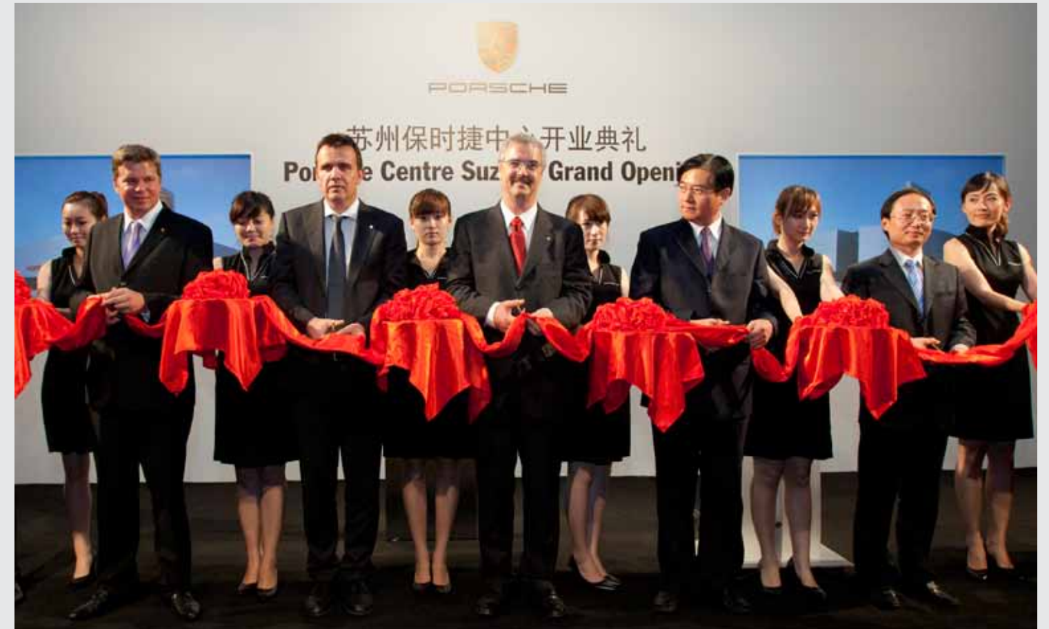
众多嘉宾出席苏州保时捷中心开业典礼剪彩仪式。

郑州保时捷中心 郑东新区商务内环路7号 450008 电话: +86 371 62008 911