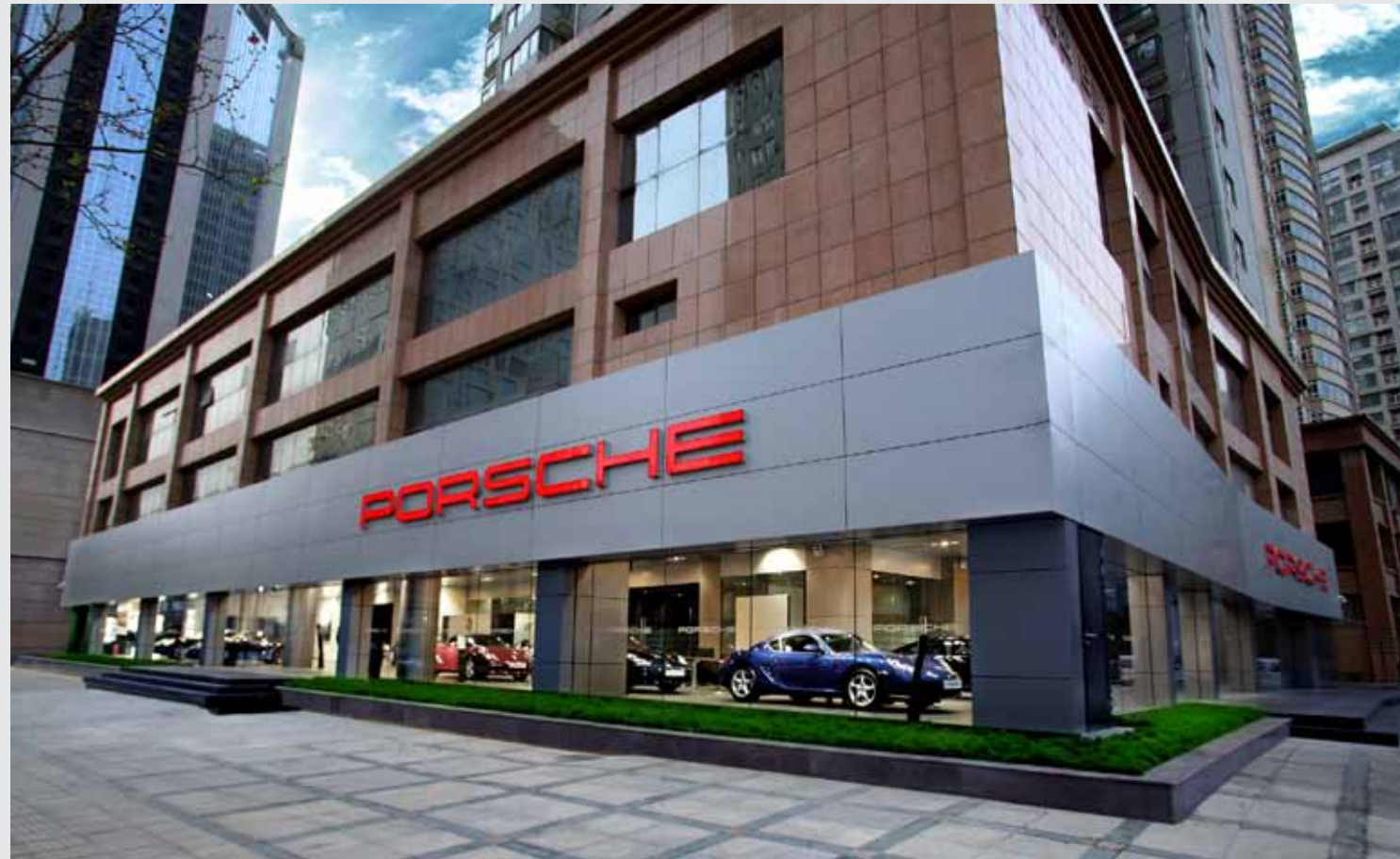
郑州保时捷中心盛大开幕，将把保时捷全系车型带给当地的跑车爱好者。