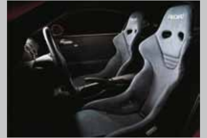
RECARO 桶状赛车座椅系列