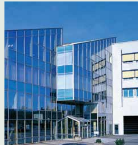
RECARO Automotive 总部, 2011

品要求, 还体现了对生态环境和社会责任的高度关注。RECARO 座椅系统运用了最先进的技术和制造工艺, 例如减重混合结构, 它在不牺牲强度、性能和安全性的同时降低了整车重量和排放。以大自然为榜样, RECARO 确保在生产过程中保持高效, 严格考虑生态环境因素, 注重可持续发展, 从而保护我们的未来。