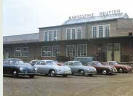
上世纪 60 年代 Reutter 工厂

是什么成就了世界汽车座椅中的领导品牌 RECARO? 源自德国的 RECARO 所展现的不仅仅是世界最顶尖的人体工学运动座椅, 其独特的设计理念让您能触摸奢华, 享受纯粹高品质人生。