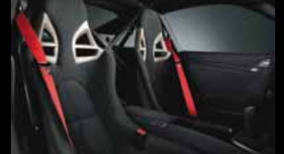
保时捷 911 GT3 RS 车型 (选装座椅)