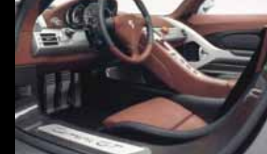
保时捷 Carrera GT 车型 (标准座椅)