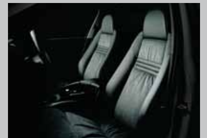
RECARO 舒适型和人体工学座椅