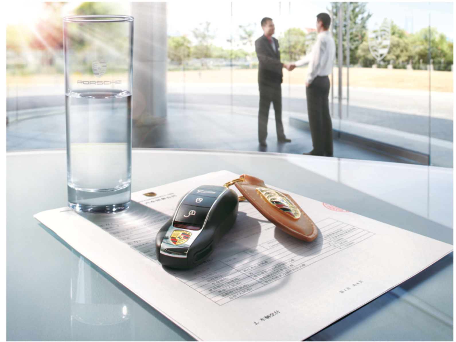
保时捷推荐 Mobil 1