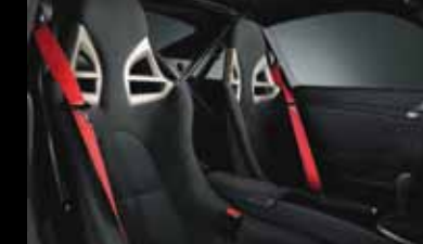
保时捷 911 GT3 车型 (标准座椅)