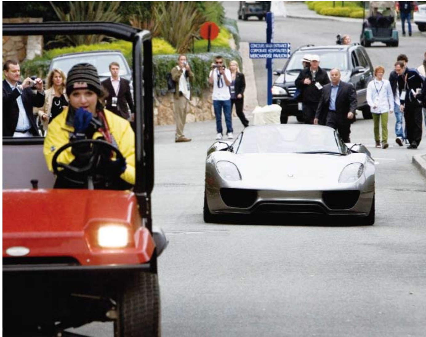
万众瞩目：保时捷 918 Spyder 首次驰骋公路。

车未至，声先闻。远处的引擎轰鸣报幕似地提醒众人，保时捷 918 Spyder 来了。经典的头灯，全新设计的黑色十辐轮毂，圆润融洽的尾翼与车尾线条，这些我在今年的北京车展上都已为之奉献过无数张特写。但这一回不同，因为这是 918 Spyder 第一次不作为展