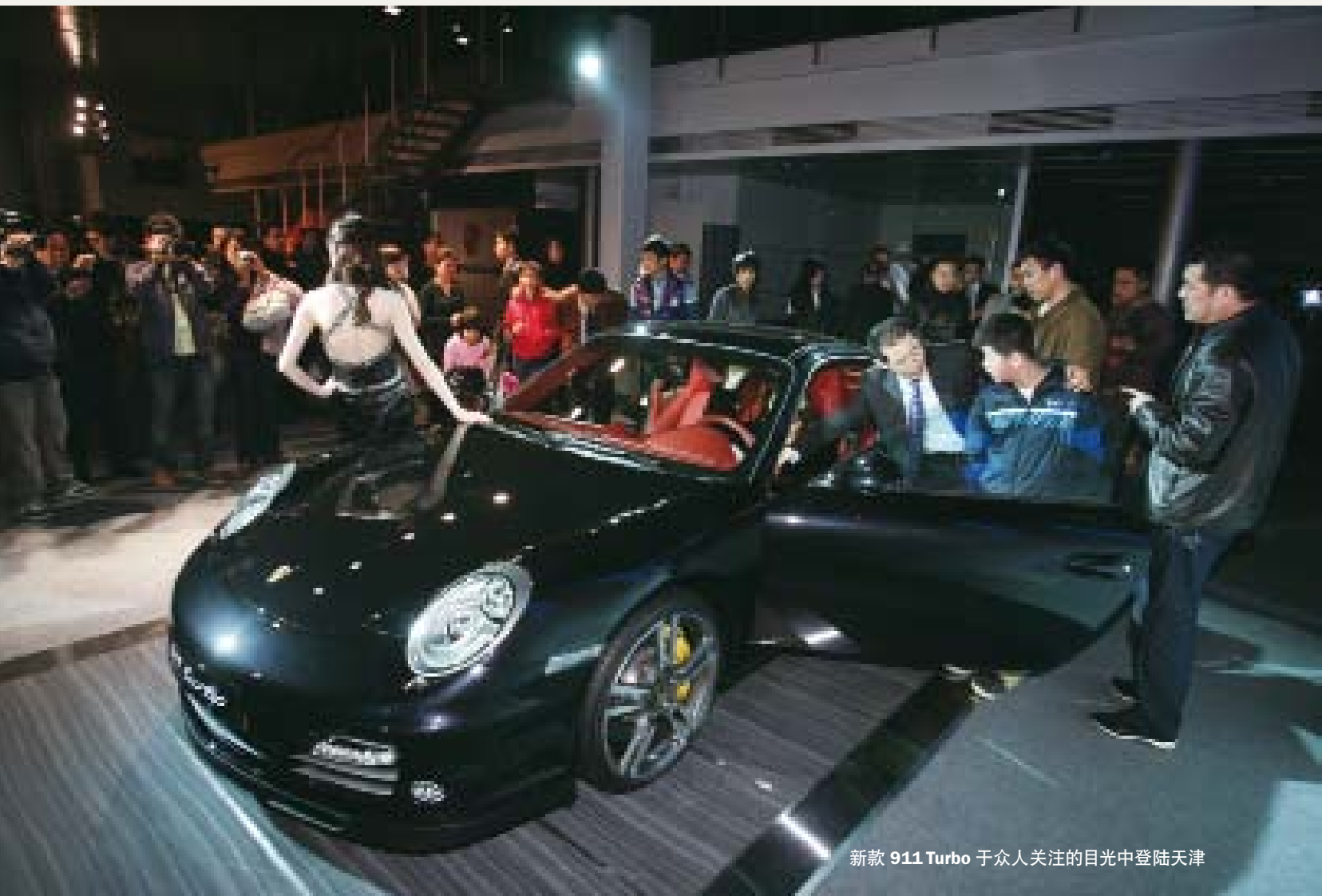
新款 911 Turbo 于众人关注的目光中登陆天津