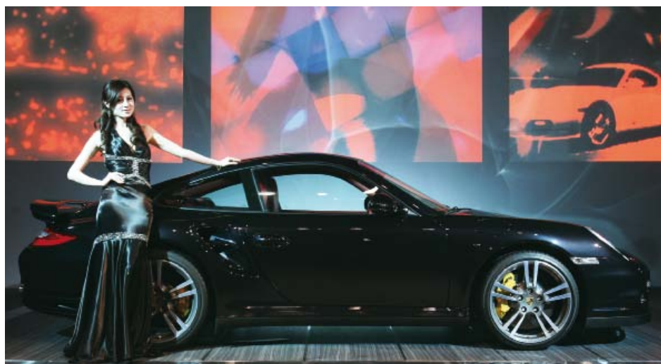
保时捷 911 Turbo 具有鲜明的标志性车身线条。这也是其不断取得成功的原因之一