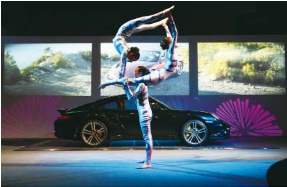
天津发布现场的杂技表演 (上图)、温州的武术表演 (下图) 折射出 911 Turbo 独有的运动精神和动感性能

以更少的油耗实现令人屏息的完美性能, 这就是跑车中的超级健将保时捷 911 Turbo 最与众不同的地方。当然保时捷的信条是不断攀越更高目标——2010 年 4 月北京车展上 911 Turbo S 的发布再次证明了这一点。全新的车型, 却秉持着相同的理念: 提高效率, 创造经典。 ◀