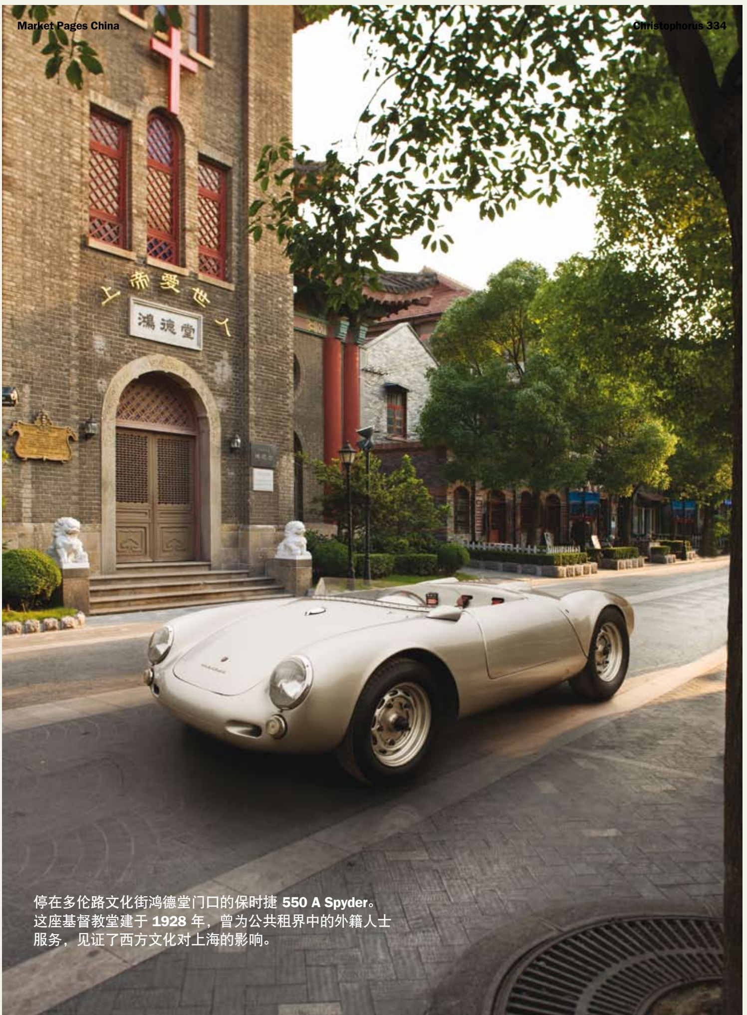
停在多伦路文化街鸿德堂门口的保时捷 550 A Spyder。 这座基督教堂建于 1928 年，曾为公共租界中的外籍人士 服务，见证了西方文化对上海的影响。