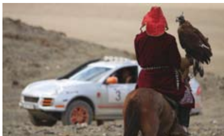
旅途中的精彩看点