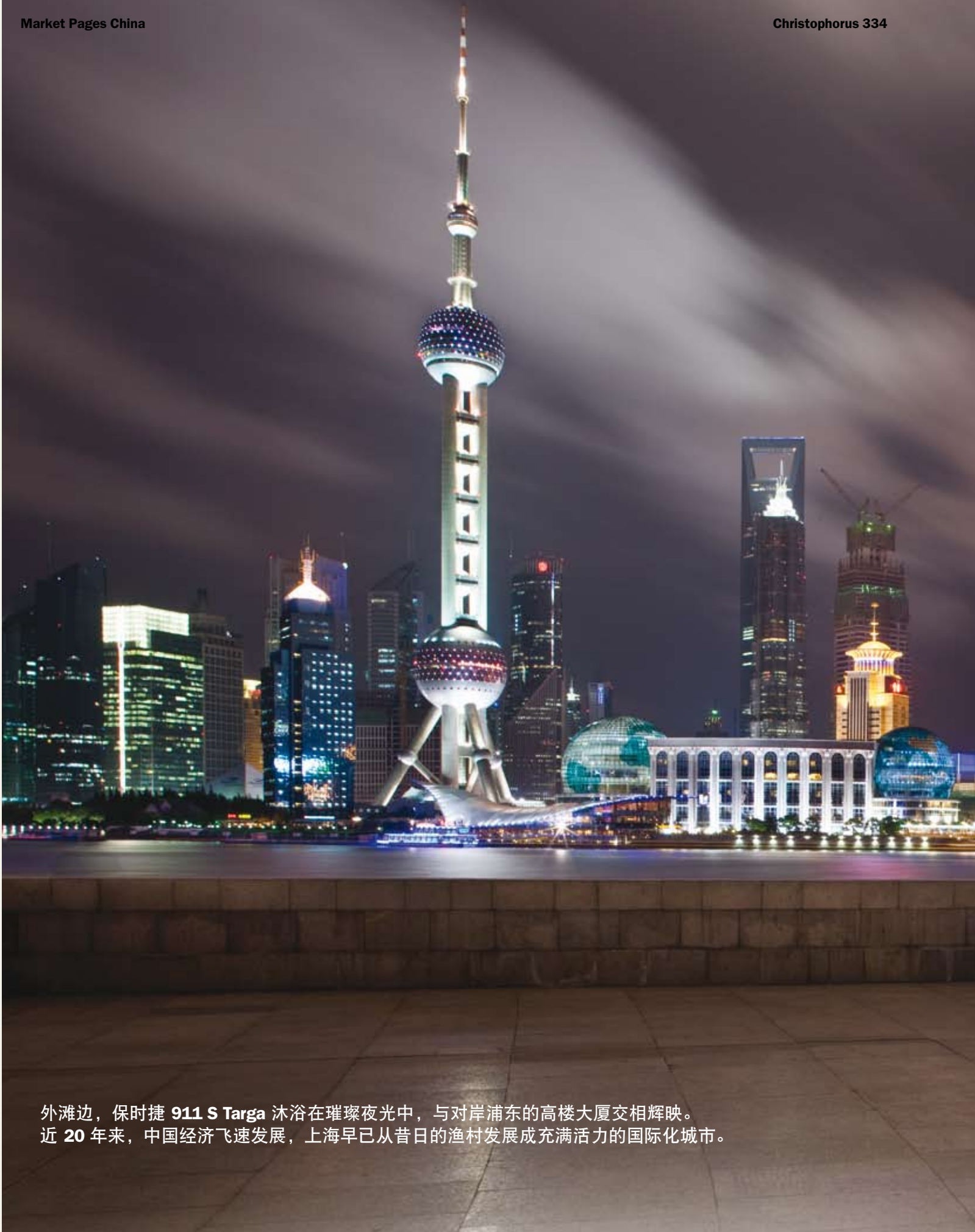
外滩边，保时捷 911 S Targa 沐浴在璀璨夜光中，与对岸浦东的高楼大厦交相辉映。近 20 年来，中国经济飞速发展，上海早已从昔日的渔村发展成充满活力的国际化城市。