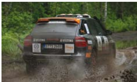
保时捷中国车队（8 号）奋力前行

保时捷中国车队初次亮相 2008 泛西伯利亚拉力赛的表现可圈可点，几次在特别路段取得前十名的好成绩。然而由于技术问题，中国车队不得不提前退出了比赛。但是，此次参赛经验也让所有人都对未来产生了期待，盼望着能在更多的主要车赛上看到中国之队的身影。