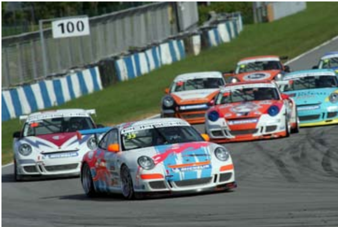
珠海国际赛车场上的激烈赛况