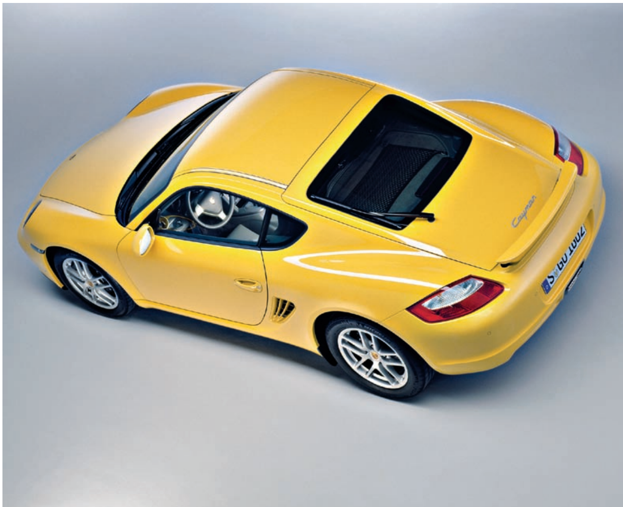
Rodas com desenho exclusivo e pinças de freio pintadas em preto identificam o Cayman lateralmente.

va um residual de aceleração. Ele retarda o corte da injeção de combustível aos cilindros do motor enquanto a rotação máxima (7.300 rpm) não é atingida.